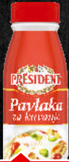
PAVLAKA ZA KUVANJE PRESIDENT 500G BOCA