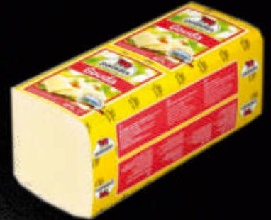
SIR GAUDA PaLADIN RFS