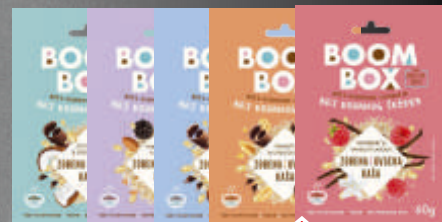
OVSENA KAŠA BOOM BOX 60G VIŠE VRSTA