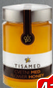
MED 450G TISAMED CVETNI