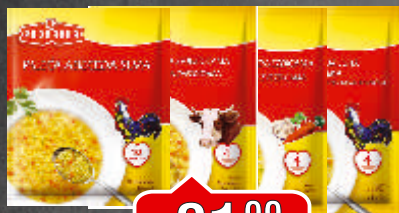
SUPA PODRAVKA 52G VIŠE VRSTA