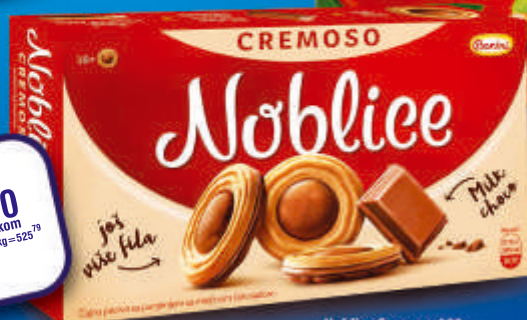
Noblisce Cremoso 190g