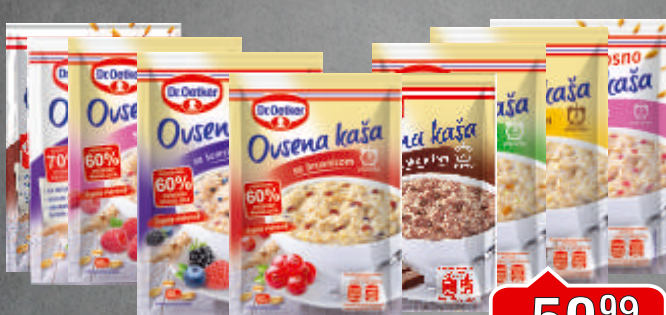
OVSENA KAŠA DR.OETKER 60G VIŠE VRSTA