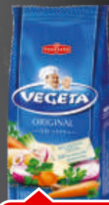
ZAČIN VEGETA PODRAVKA 200G