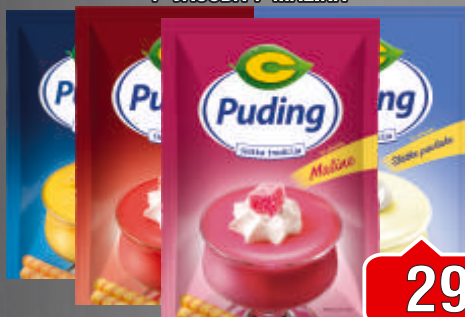
PUDING C 40G SLATKA PAVLAKA / VANILA / JAGODA / MALINA