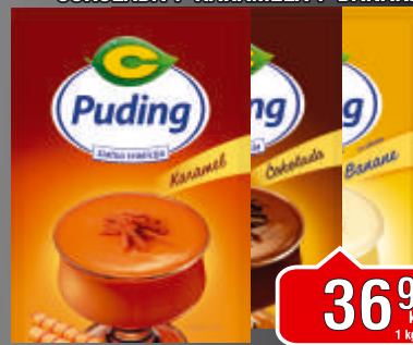
PUDING C 40G ČOKOLADA / KAREMELA / BANANA