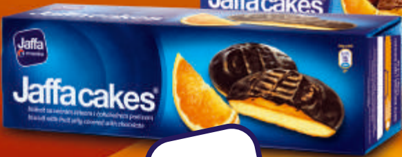
Jaffa cakes Milk Choco 150g Jaffa cakes 150g