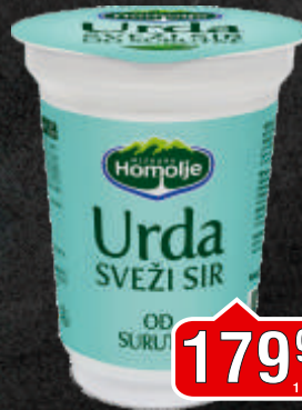
SIR URDA EKOFIL 400G