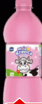
JOGURT IMLEK KRAVICA 1.5L 2,8% PET