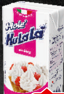
SLATKA PAVLAKA HOLE 0,5L