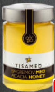
MED 450G TISAMED BAGREMOV