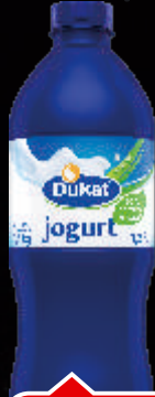
DUKAT JOGURT 1.5L PLAVI 3,2%