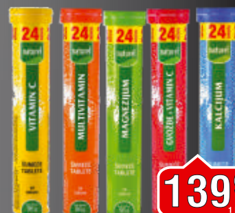
NATUREL ŠUMEĆE TABLETE 96G VIŠE VRSTA