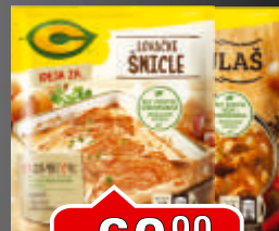
ZAČIN C IDEJA ZA LOVAČKE ŠNICLE 42G / GULAŠ 50G