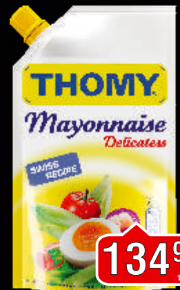
MAJONEZ THOMY DELICATESS 280ML