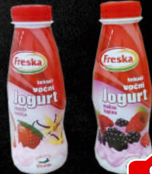
JOGURT VOČNI FRESKA 330ML JAGODA-VANILA / MALINA-KUPINA VINDIJA