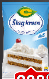
ŠLAG KREM C 500G