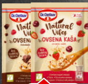
OVSENA KAŠA DR.OETKER 60G