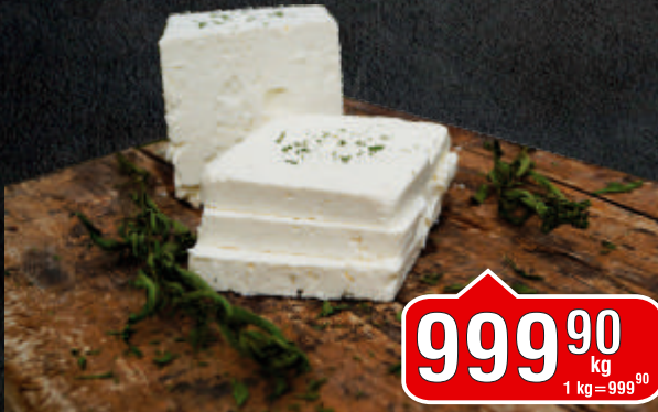
SIR HOMOLJSKA BELA KRIŠKA RFS