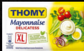
MAJONEZ THOMY DELICATESS 160G KESICA