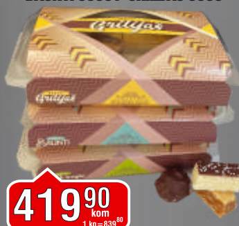
KOLAČ LEŠNIK KUGLE 500G VANILICA BAUNTI 500G / GRILJAŠ 500G