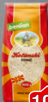
PIRINAČ IZZI 900G KOČANSKI