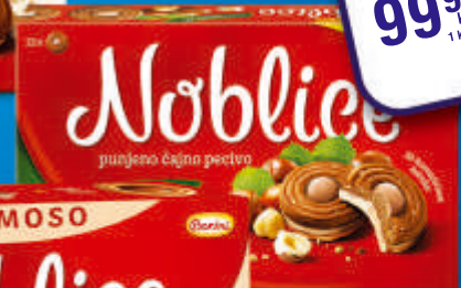
Noblisce Nougat fil 167g