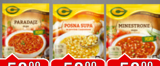
SUPA C 60G PARADAJZ / POSNA / MINISTRONE