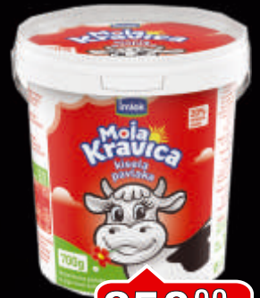
KISELA PAVLAKA 20% IMLEK 700G