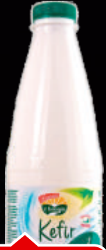
KEFIR Z BREGOV 1L 3,5% MM