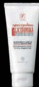
KREMA GLICERINSKA 80ML FITOGAL