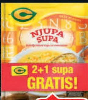
SUPA NJUPA C 45G 2+1 GRATIS