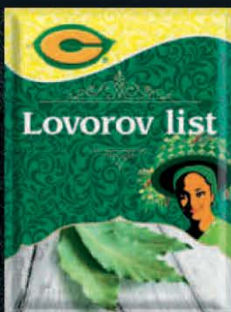
LOVOROV LIST C 8G