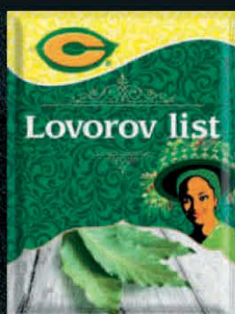
LOVOROV LIST C 8G