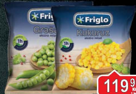
SMRZNUTI MLADI GRAŠAK 450G FRIGLO SMRZNUTI MLADI ŠEĆERAC 450G FRIGLO