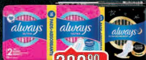
ULOŠCI ALWAYS DUO PAK VIŠE VRSTA