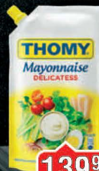
MAJONEZ THOMY 280ML DELIKATESNI DOJPAK