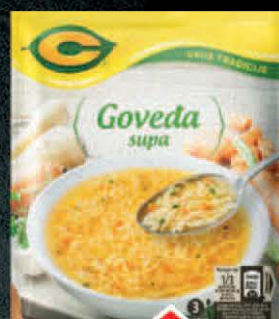
SUPA C 40G GOVEDA BISTRA UKUS TRADICIJE