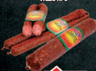
ČAJNA KOBASIČA TRLIĆ RFS