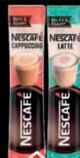
KAFA NESCAFÉ CAPPUCCINO/ LATTE 15G KESICA