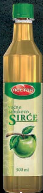
SIRĆE JABUKOVO NECTAR 500ML