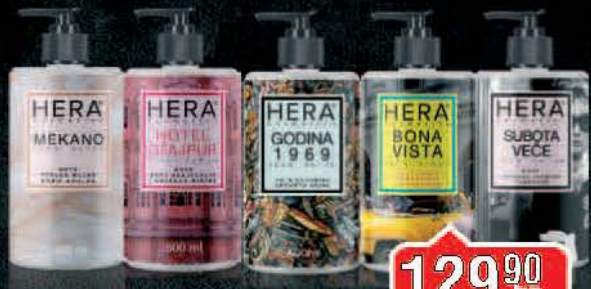
TEČNI SAPUN HERA 0,5L VIŠE VRSTA