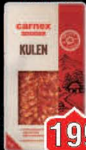
KULEN CARNEX 100G SLAJS