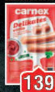
VIRŠLA CARNEX DELIKATES 205G