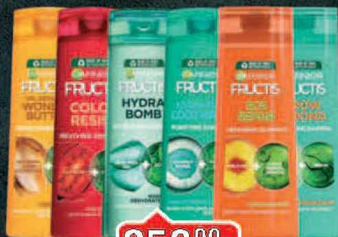
ŠAMPON GARNIER FRUCTIS 250ML VIŠE VRSTA