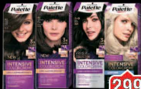
FARBA ZA KOSU PALETTE VIŠE VRSTA