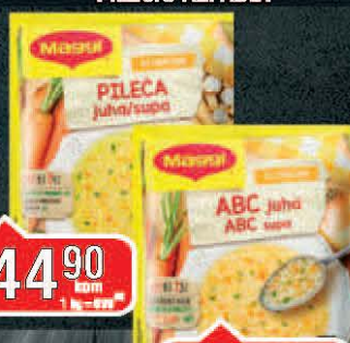
SUPA MAGGI 37G BISTRA PILEĆA/ALFABET