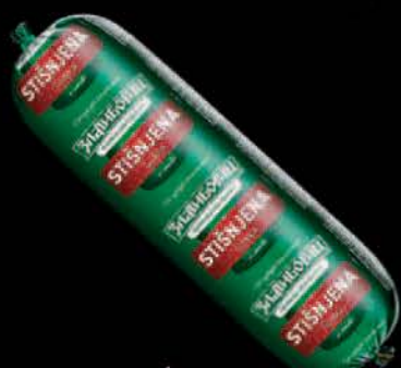
STIŠNJENA ŠUNKA U OMTU RFS ZLATIBORAC