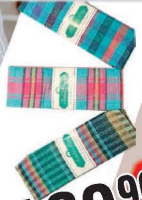
STOLNJAK FABBRICITY 140X140CM