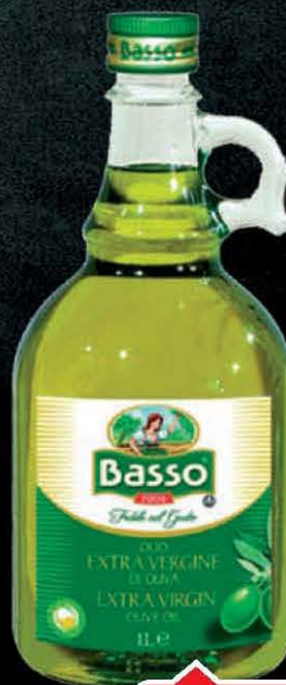
ULJE MASLINOVO BASSO 1L AMPHORA