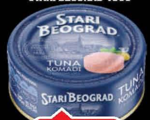
TUNA KOMADI RETRO STARI BEOGRAD 160G