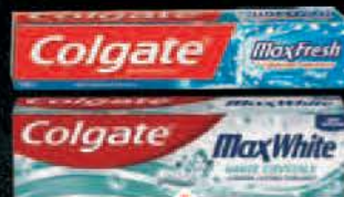
PASTA ZA ZUBE COLGATE 75ML MAX FRESH COOL MINT / WHITE CRYSTAL MINT