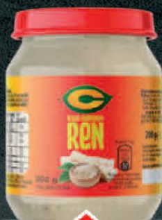
REN C 200G