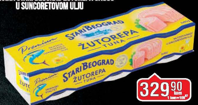
TUNJEVINA STARI BEOGRAD ŽUTOREPA 3X80G U SUNCORETOVOM ULJU