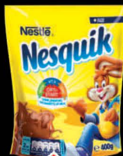
NAPITAK NESQUIK 400G