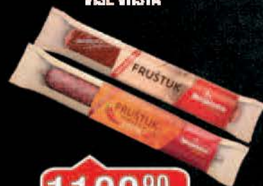
KOBASIČA FRUŠTUK VIŠE VRSTA