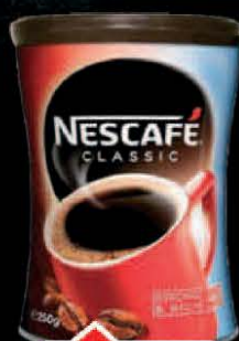
KAFA NESCAFÉ CLASSIC 250G LIMENKA