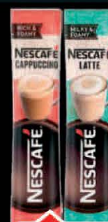
KAFA NESCAFE CAPPUCCINO/ LATTE 15G KESICA