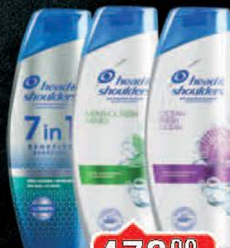
ŠAMPON HEAD SHOULDERS 380ML VIŠE VRSTA