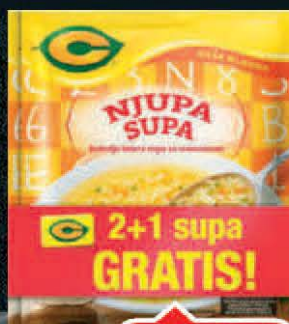
SUPA NJUPA C 45G 2+1 GRATIS