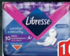
ULOŠCI LIBRESSE GOODNIGHT MAXI DUO 10/1