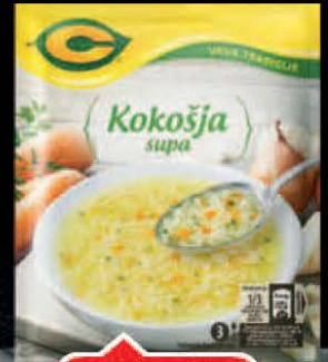
SUPA C 37G KOKOŠJA UKUS TRADICIJE