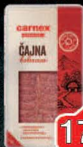
ČAJNA KOBASICA SLAJS 100G CARNEX