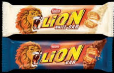
ČOKOLADICA LION 40G CHOCOLATE/WHITE