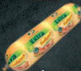
POSEBNA EXTRA PILEĆA 600G PTUJ