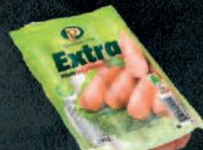
VIRŠLE PTUJ EXTRA 200G