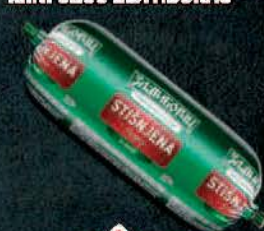
STIŠNJENA ŠUNKA U OMTU MINI 320G ZLATIBORAC