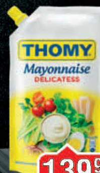
MAJONEZ THOMY 280ML DELIKATESNI DOJPAK