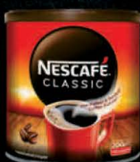
KAFA NESCAFÉ CLASSIC 200G LIMENKA