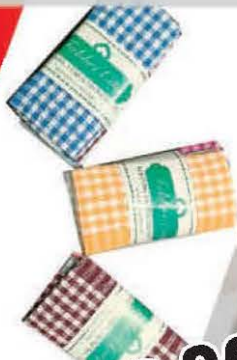
KRPA KUHINJSKA 50X70 3/1 STORETURCO