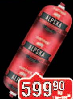
ALPSKA KOBASICA CARNEX