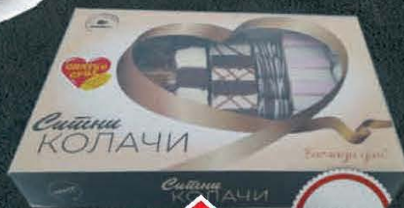
KOLAČI SLATKO SRCE 1KG