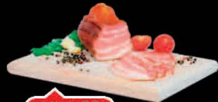
SLANINA HAMBURŠKA DIMLJENA KIM