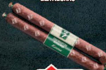
KOBASIČA KLASIK ZLATIBORAC