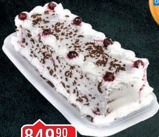
TORTA SLATKO SRCE ŠVARCVALD ČETVRTASTA/MALI ŠNIT/OKRUGLA/ SREDNJI ŠNIT