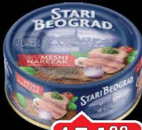
MESNI NAREZAK RETRO STARI BEOGRAD 400G