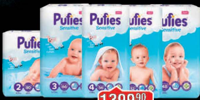
PELENE PUFIES SENSITIVE VIŠE VRSTA