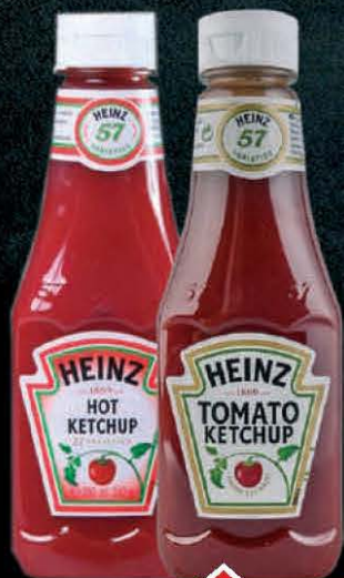
KEČAP HEINZ 342G LJUTI /BLAGI