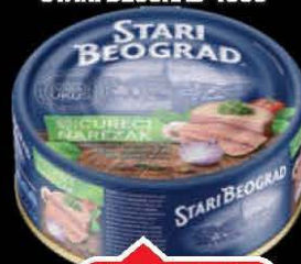
MESNI NAREZAK ČUREČI RETRO STARI BEOGRAD 400G