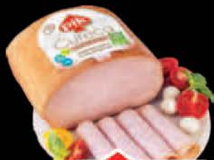
ČUREĆA PRSA DIMLJENA PIK VAK