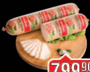
PILEĆE GRUDI DELIKATES NEOPLANTA RFS