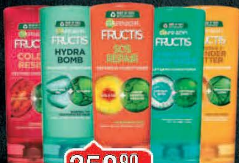
REGENERATOR GARNIER FRUCTIS 200ML VIŠE VRSTA