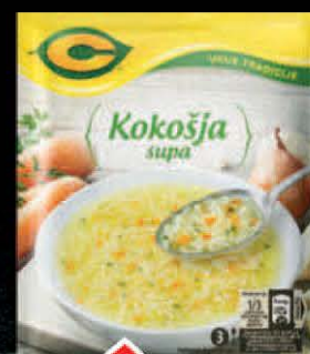
SUPA C 37G KOKOŠJA UKUS TRADICIJE