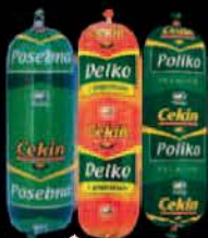
KOBASIČA CEKIN 350G VIŠE VRSTA