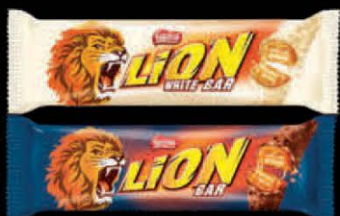
ČOKOLADICA LION 40G CHOCOLATE/WHITE