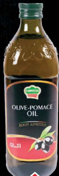
ULJE MASLINOVO CORPEZZA 1L OD KOMINE MASLINA PB