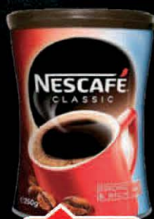
KAFA NESCAFE CLASSIC 250G LIMENKA