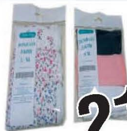
ŽENSKI DONJI VEŠ S-M / L-XL 3 KOMADA