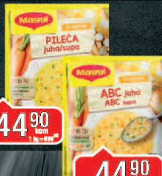
SUPA MAGGI 37G BISTRA PILEĆA/ALFABET