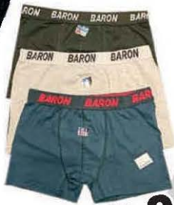
BOKSERICE MUŠKE STORETURCO