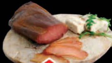
SIVA SVINJSKA PEČENICA TRLIĆ