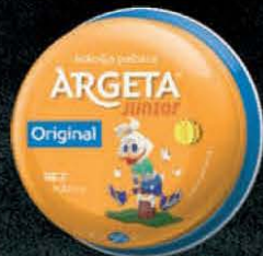
PAŠTETA ARGETA JUNIOR 95G