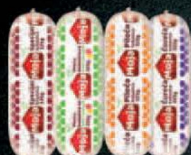
KOBASIČA 325G MOJA RADNJA NEOPLANTA