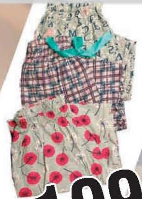
PIDŽAMA ŽENSKA DONJI DEO STORETURCO