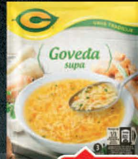
SUPA C 40G GOVEĐA BISTRA UKUS TRADICIJE