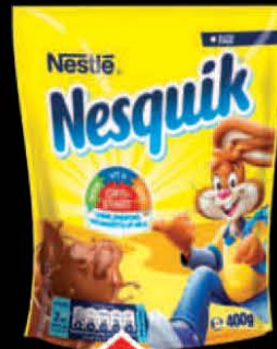
NAPITAK NESQUIK 400G