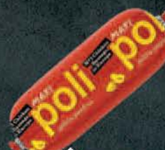
PARIZER POLI PTUJ MAXI