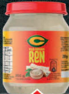
REN C 200G