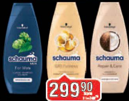
ŠAMPON SCHAUMA 400ML VIŠE VRSTA