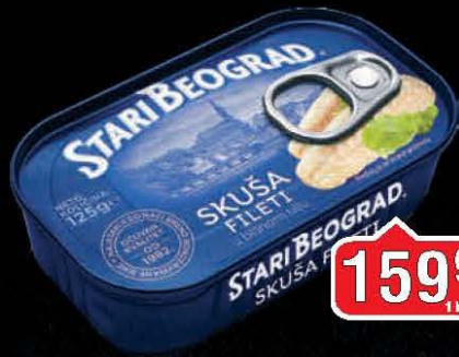
SKUŠA FILETI U BILJNOM ULJU STARI BEOGRAD 125G