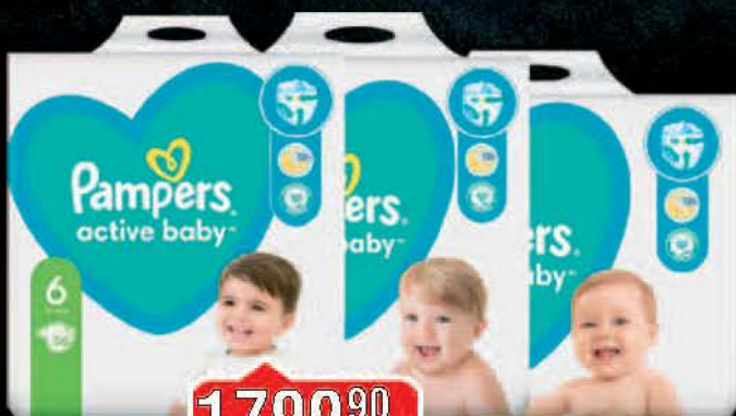
PELENE PAMPERS GIANT PACK VIŠE VRSTA