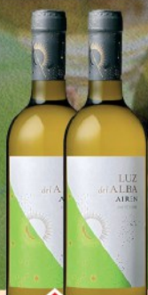
VINO 0,75L BELO LUZ DEL ALBA TEMPRNILLO