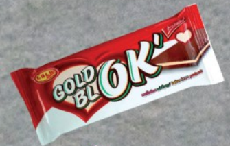
KREM BLOK GOLD PACK 90G