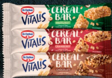
DESERT VITALIS CEREAL BAR 35G VIŠE VRSTA