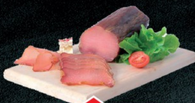
PEČENICA LOVČENSKA RFS