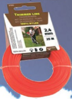
FLEX NIT ZA KOSAČICU 2,4MMX25M