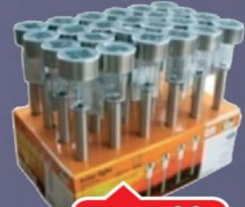
LAMPA SOLARNA BAŠTENKA 36CM 3