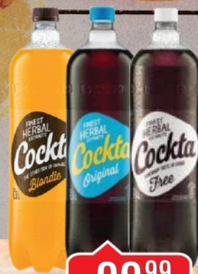
COCKTA ORIGINAL 1,5L FINEST HERBAL/ FREE