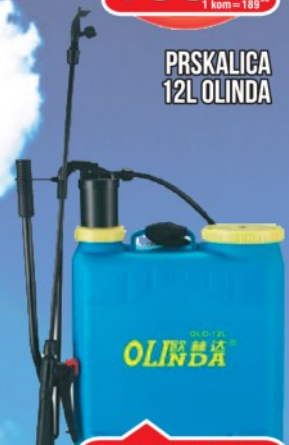
PRSKALICA 12L OLINDA