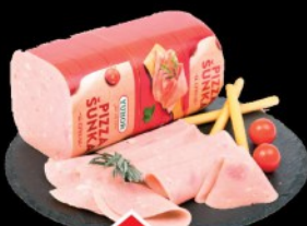
PIZZA ŠUNKA YUHOR RFS