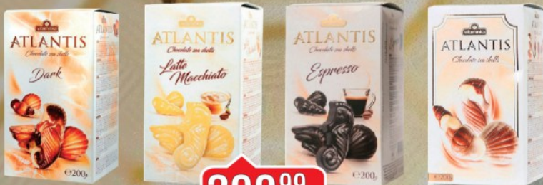
PRALINE ATLANTIS 200G VITAMINKA