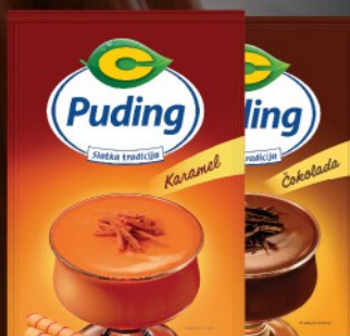
PUDING C 40G ČOKOLADA / KARAMELA