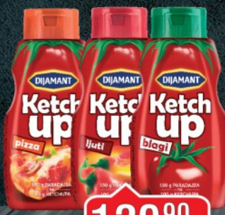
KEČAP DIJAMANT 500G BLAGI/LJUTI/PIZZA