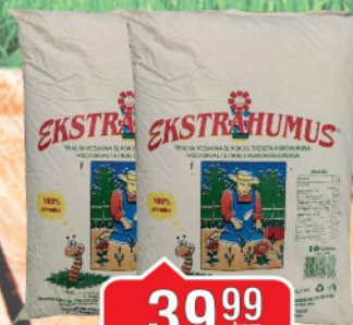
ZEMLJA ZA CVEČE EKSTRAHUMUS 3L