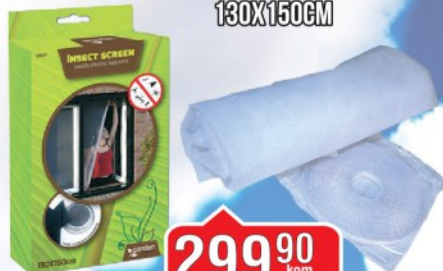
MREŽA PROTIV INSEKATA 130X150CM