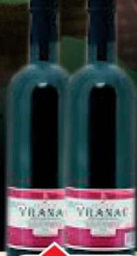
VINO VRANAC 1L PET VINARIJA STATUS