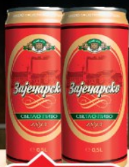
PIVO ZAJEČARSKO 0,5L SVETLO LIMENKA