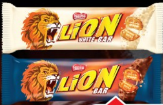
ČOKOLADICA LION 41G CHOCOLATE/WHITE