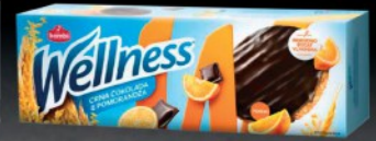
KEKS WELLNESS 155G SA POMORANŽOM I ČOKOLADOM