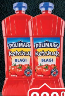
KEČAP POLIMARK 1L BLAGI