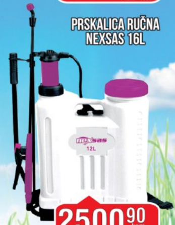
PRSKALICA RUČNA NEXSAS 16L