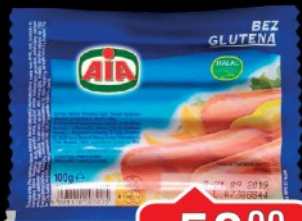
VIRŠLA ŽIVINSKA FRANKFURT 100G