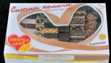
KOLAČI SLATKO SRCE 1KG POSNI