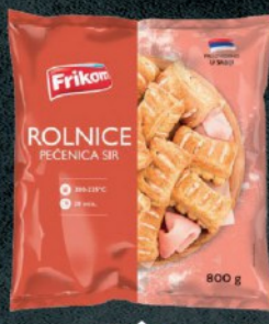
SMRZNUTE ROLNICE FRIKOM 800G PEČENICA I SIR