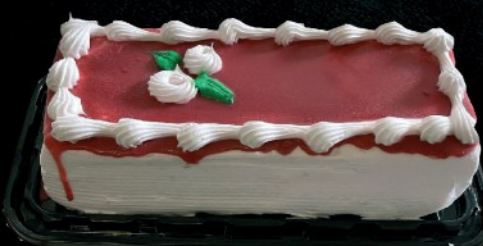
TORTA SH VIŠE UKUSA OKRUGLA/SREDNJI ŠNIT