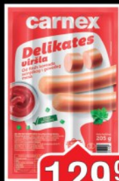
VIRŠLA CARNEX DELIKATES 205G