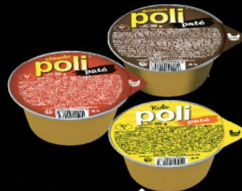
PAŠTETE POLI PATE PTUJ 50G VIŠE VRSTA