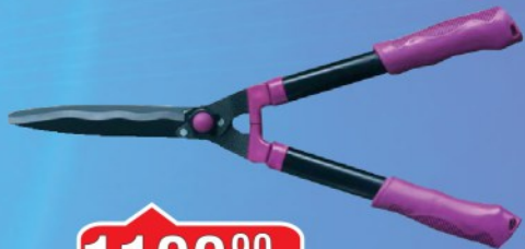
MAKAZE ZA ŽIVU OGRADU NEXSAS NH340