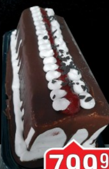
TORTA SLATKO SRCE KAPRI ČETVRTASTA/OKRUGLA/MALI ŠNIT/SREDNJI ŠNIT