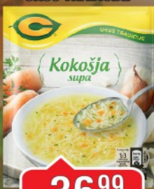
SUPA C 37G KOKOŠIJA UKUS TRADICIJE