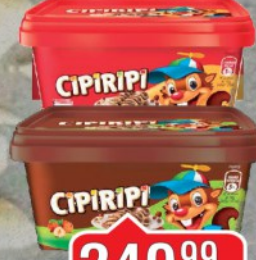
KREM CIPIRIPI 400G /KREM NOUGAT