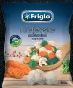
SMRZNUTA KRALJEVSKA MEŠAVINA 450G FRIGLO