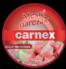
MESNI NAREZAK CARNEX 95G