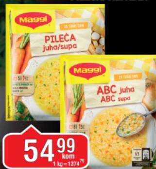
SUPA MAGGI 44G BISTRA PILEĆA/ALFABET