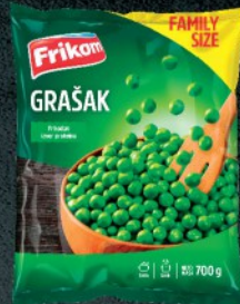
SMRZNUTI GRAŠAK 700G FRIKOM