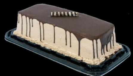
TORTA BEL GUSTO SREDNJI ŠNIT