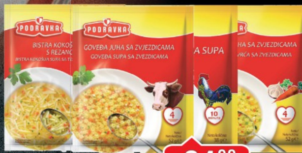
SUPA PODRAVKA 52G GOVEĐA SA ZVEZDICAMA/ 52G KOKOŠIJA SA TESTENINOM I POVRĆEM/ POVRTNA SA ZVEZDAMA 52G/38G PILEĆA ABECEDA