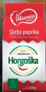
PAPRIKA HORGOSKA SLATKA 100G