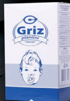
GRIZ C 400G