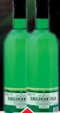
VINO SMEDEREVKA 1L PET VINARIJA STATUS