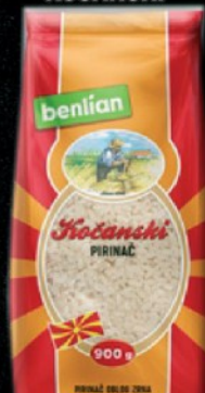
PIRINAČ IZZI 900G KOČANSKI