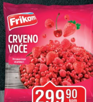
SMRZNUTO CRVENO VOĆE FRIKOM 300G