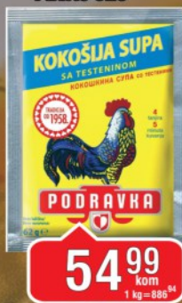
SUPA PODRAVKA PEVAC 62G