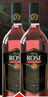
VINO 1L ROSE RUBIN