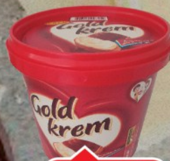
KREM GOLD PACK 800G