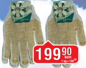
RUKAVICE PAMUČNÉ TRIKO