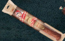
KOBASICA GRANIČARSKA GAVRILLOVIĆ RFS