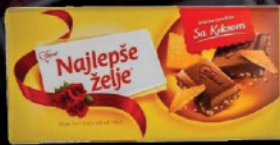
ČOKOLADA NAJLEPŠE ŽELJE KEKS 170G