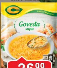
SUPA C 40G GOVEĐA UKUS TRADICIJE