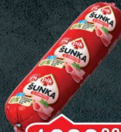
ŠUNKA U OMOTU PIK RFS