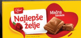
ČOKOLADA NAJLEPŠE ŽELJE MLEČNA 200G