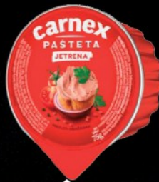
PAŠTETA JETRENA CARNEX 75G