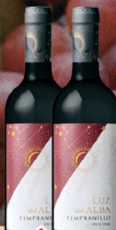
VINO 0,75L CRVENO LUZ DEL ALBA TEMPRNILLO