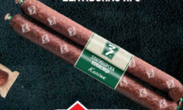
KOBASICA KLASIK ZLATIBORAC RFS