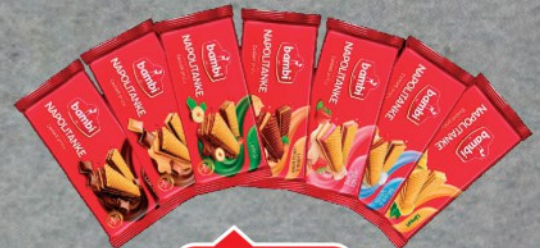
BAMBI NAPOLITANKE 185G VIŠE VRSTA