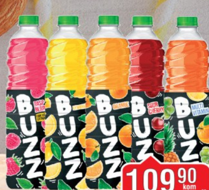
SOK NECTAR BUZZ 1,5L VIŠE VRSTA