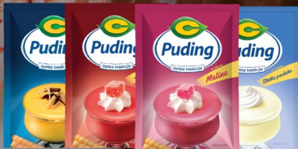
PUDING C 40G SLATKA PAVLAKA / VANILA / JAGODA / MALINA