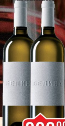
VINO BELINA 0,75L MATIJAŠEVIC