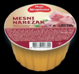
MESNI NAREZAK NEOPLANTA 150G