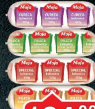
KOBASICA 325G MOJA RADNJA NEOPLANTA VIŠE VRSTA