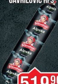
ALPSKA KOBASICA GAVRILLOVIĆ RFS