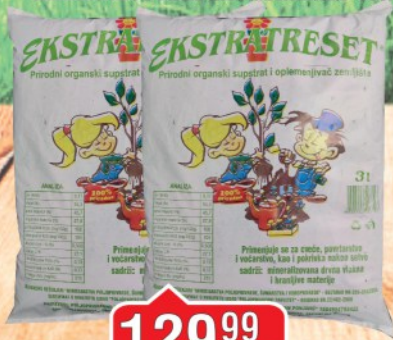
ZEMLJA ZA CVEČE EKSTRAHUMUS 10L