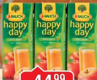
SOK HAPPY DAY 0,2L BRESKVA / JABUKA