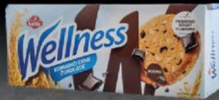
KEKS WELLNESS 210G SA ČOKOLADOM