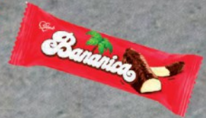
KREM BANANA 25G STARK