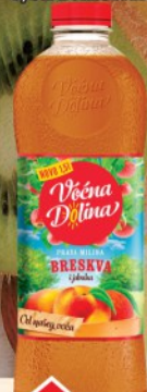
SOK VOĆNA DOLINA 1,5L BRESKVA