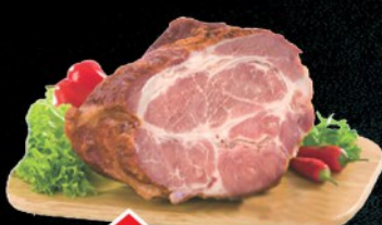
DIMLJENI VRAT KIM RFS