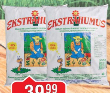
ZEMLJA ZA CVEČE EXTRATRESET 3L