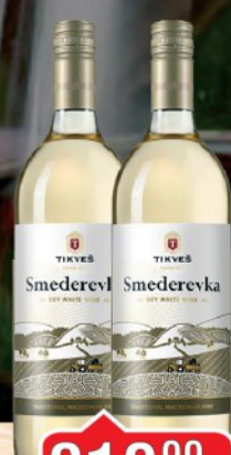
VINO SMEDEREVKA 1L TIKVEŠ