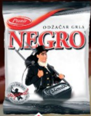
BOMBONE PIONIR 200G NEGRO