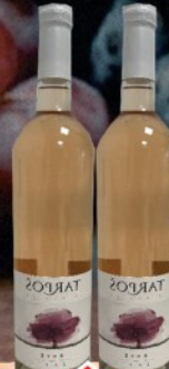
VINO ROZE TARPOŠ 0,75L VINARIJA TRAPOŠ