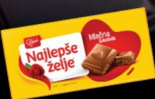
ČOKOLADA NAJLEPŠE ŽELJE MLEČNA 90G