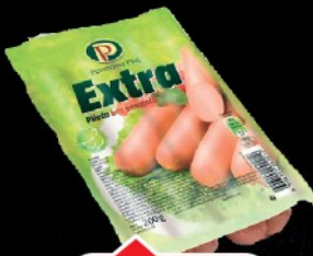
VIRŠLE PTUJ EXTRA 200G