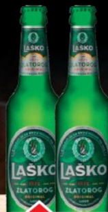
PIVO LAŠKO 0,5L RGB