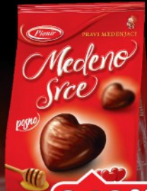
MEDENJACI MEDENO SRCE 350G