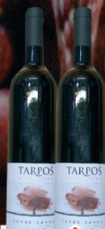
VINO CUVEE CRVENI 0,75L VINARIJA TARPOŠ