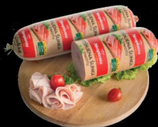
STIŠNJENA ŠUNKA NEOPLANTA RFS