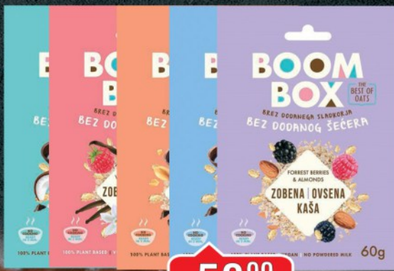
OVSENA KAŠA BOOM BOX 60G VIŠE VRSTA