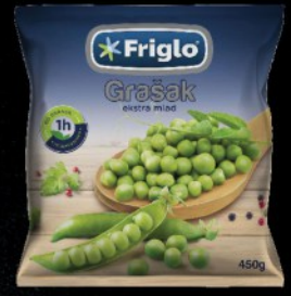
SMRZNUTI MLADI GRAŠAK 450G FRIGLO