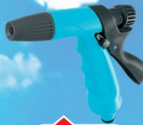
PIŠTOLA MLAZNICA CELLFAST