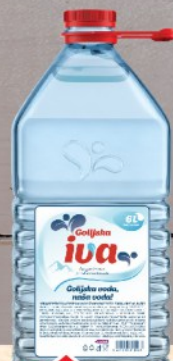
VODA IVA BALON 6L