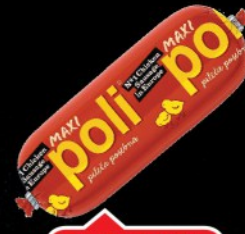
PARIZER POLI PTUJ MAXI RFS