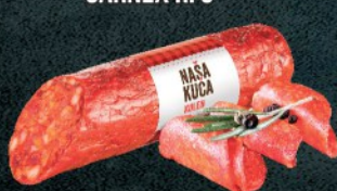
KULEN NAŠA KUĆA CARNEX RFS