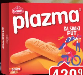
KEKS PLAZMA 600G