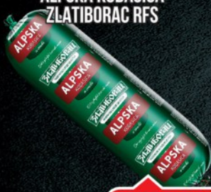
ALPSKA KOBASICA ZLATIBORAC RFS