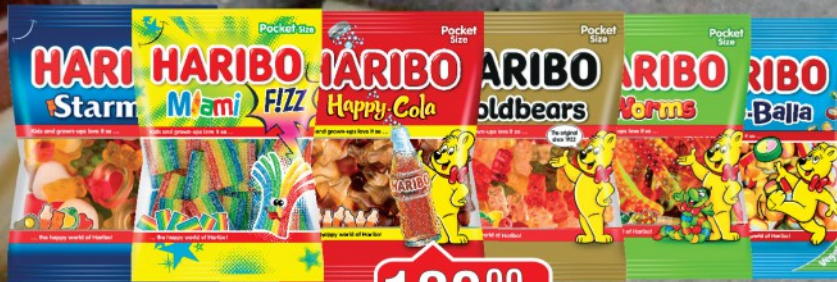
GUMENE BOMBONE HARIBO 100G VIŠE VRSTA