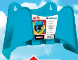
ZIDNI NOSAČ ZA CREVO CELLFAST