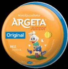
PAŠTETA ARGETA JUNIOR 95G