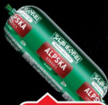
ALPSKA KOBASICA MINI ZLATIBORAC 320G