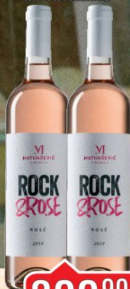
VINO ROCK&ROSE 0,75L MATIJAŠEVIC