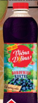
SOK VOĆNA DOLINA 1,5L BOROVNICA KOKTEL