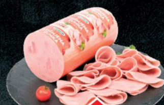
STIŠNJENA ŠUNKA YUHOR RFS