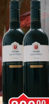
VINO KRATOŠIJA 0,75L TIKVEŠ