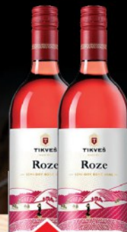
VINO ROZE 1L TIKVEŠ