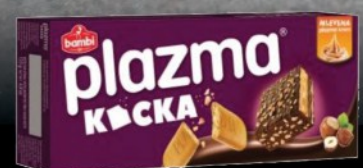
PLAZMA KOČKA PRELIVENA ČOKOLADOM 135G