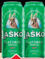
PIVO LAŠKO 0,5L LIMENKA