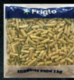
SMRZNUTA BORANIJA ŽUTA 1KG FRIGLO