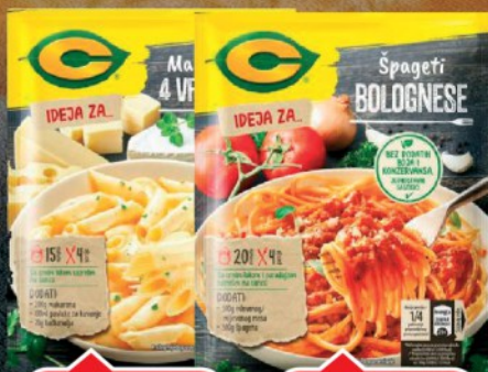
SOS C 32G PILETINA SA 4 VRSTE SIRA/ SOS C 50G BOLOGNESE