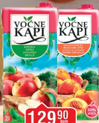
SOK VOĆNE KAPI 2L BRESKVA / JABUKA