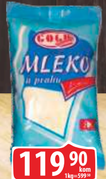
MLEKO U PRAHU GOLD 200G ZAMENA