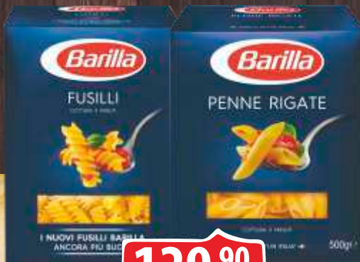
MAKARONE BARILLA 500G FUSILLI MAKARONE BARILLA PENNE RIGATE 500G