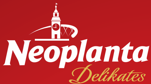
ALPSKA KOBASICA NEOPLANTA RFS