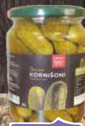
KRASTAVCI KORNIŠONI 690G FORTUNA ŠPAJZ