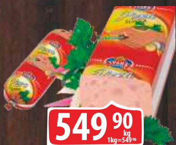
PIZZA ŠUNKA TRLIĆ RFS