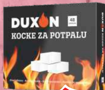
KOCKE ZA POTPALU DUXON 48/1