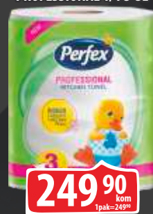
PAPIRNI UBRUSI PERFEX PROFESSIONAL 1/1 3-SL