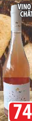
VINO MAGIJA 0,75L CHÂTEAU PRINCE