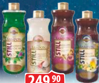
ŠAMPON BIO STILL 1L VIŠE VRSTA