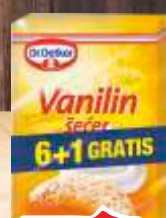
VANILIN ŠEĆER DR.OETKER 6+1GRATIS