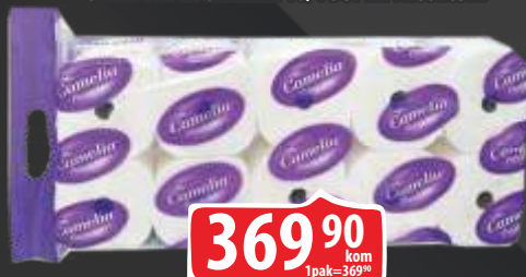
TOALET PAPIR CAMELIA 10/1 SUPER TROSLOJNI