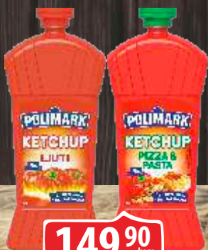
KEČAP POLIMARK 500G LJUTI/PIZZA