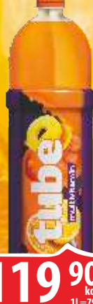
SOK TUBE MULTIVITAMIN 1,5L PET KNJAZ