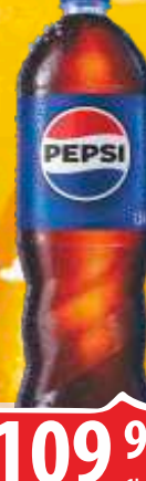
SOK PEPSI COLA 1,5L PVC