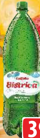
VODA BISTRICA 2L GAZIRANA