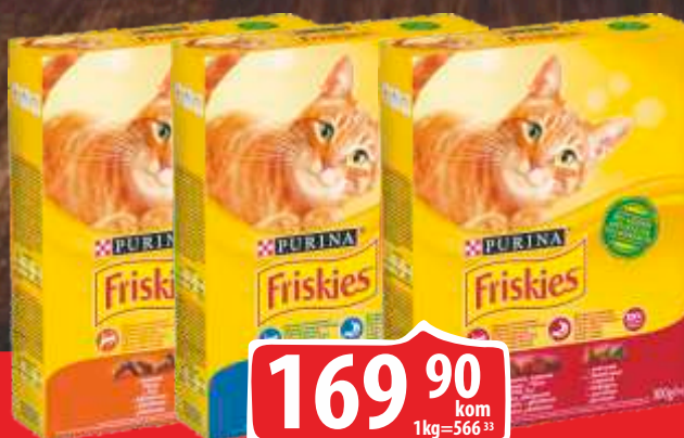
HRANA ZA MAČKE FRISKIES LOSOS BRIKET/MEŠO PILETINA POVRĆE/PILETINA I ŠARGAREPA 300G