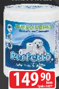
PAPIRNI UBRUSI PERFETTO JUMBO U400 2SL