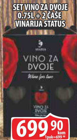
SET VINO ZA DVOJE 0,75L + 2 ČAŠE VINARIJA STATUS