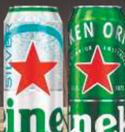
PIVO HEINEKEN 0,5L SILVER LIMENKA