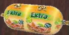
POSEBNA EXTRA PILEĆA 600G PTUJ