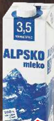
MLEKO ALPSKO 1L 3,5%MM DUGOTRAJNO