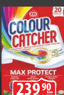
HVATAČ BOJA K2R 20/1