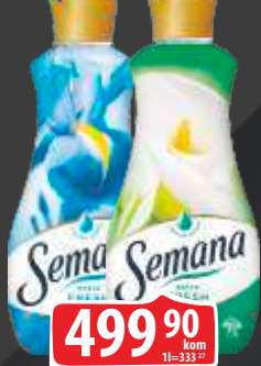
OMEKŠIVAČ SEMANA 1.5L EXTRA FRESH BRIGHT SKY EXTRA FRESH CLEAR BREEZE