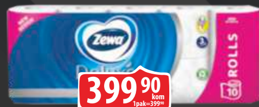
TOALET ROLNA ZEWA DELUXE 10/1 PURE WHITE