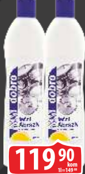
VIM TEČNI DOBRO ABRAZIV 800G LIMUN