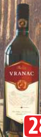
VINO VRANAC 1L RUBIN