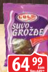
SUVO GROŽĐE GOLD 100G