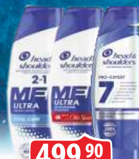
ŠAMPON HEAD&SHOULDERS 250ML VIŠE VRSTA