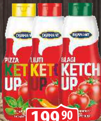
KEČAP DIJAMANT BLAGI LJUTI/PIZZA 1L