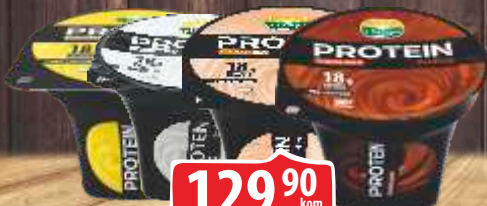
PROTEIN PUDING 180G VIŠE VRSTA