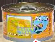
TUNJEVINA HAPPY TUNA 95G KOMADI