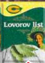
LOVOROV LIST C 8G