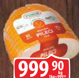
DIMLJENA PILEĆA PRSA YUHOR RFS