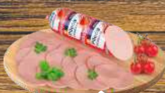
PILEĆA POSEBNA DOBRO RFS