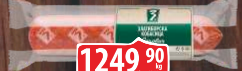
SENDVIČ KOBASICA ZLATIBORAC RFS