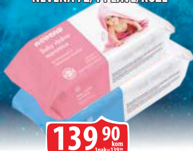
VLAŽNE MARAMICE BABY NEVENA 72/1 PLAVE/ROZE