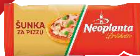
ŠUNKA ZA PIZZU NEOPLANTA 330G