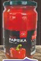
PAPRIKA FILETI 680G FORTUNA ŠPAJZ