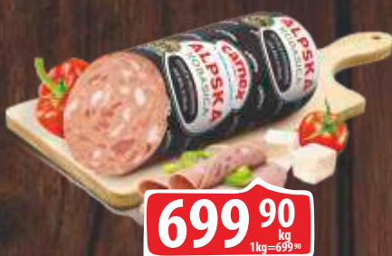
ALPSKA KOBASICA CARNEK RFS