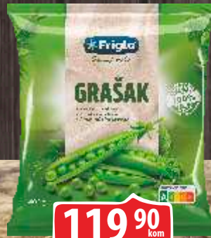
SMRZNUTI EXTRA MLADI GRAŠAK 400G FRIGLO