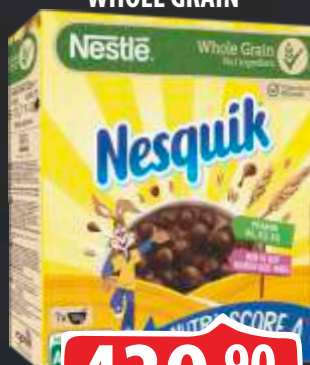
NESQUIK ŽITARICE 375G WHOLE GRAIN