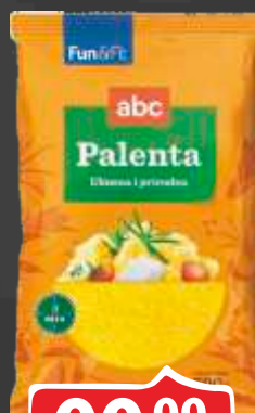
PALENTA ABC 500G FLORIDA BEL