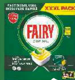
TABLETE FAIRY ZA SUDOVE ALL IN ONE 116/1