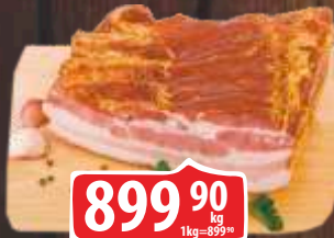
SLANINA HAMBURŠKA DIMLJENA KIM RFS