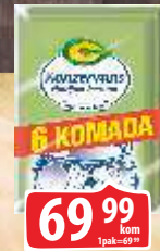
KONZERVANS C 5G 6/1