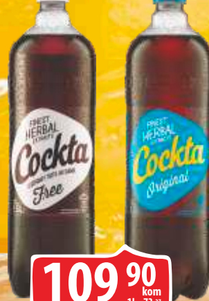
SOK COCKTA 1,5L ORIGINAL FINEST HERBAL FREE/ HERBAL