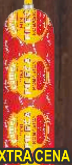
PILEĆA KOBASICA MINI 300G CARNEK