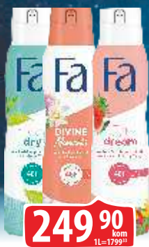
DEZODORANS FA 150ML VIŠE VRSTA