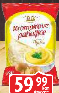
KROMPIR PIRE 100G UNAC