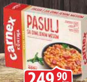
PASULJ SA DIMLJENIM MESOM 400G CARNEX