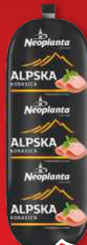
ALPSKA MINI NEOPLANTA 350G