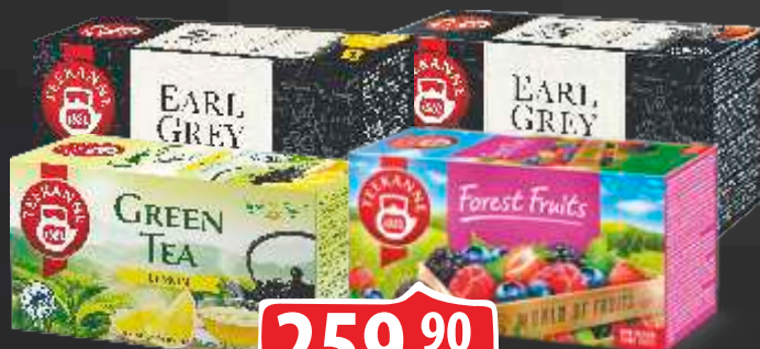
ČAJ TEEKANNE VIŠE VRSTA