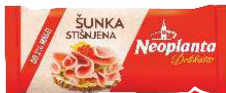
STIŠNJENA ŠUNKA MINI NEOPLANTA 350G