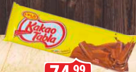
KAKAO KREM TABLA GOLD 200G