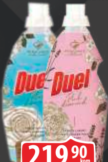
OMEKŠIVAČ DUEL 800ML BLUE DIAMOND/PINK DIAMOND