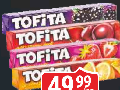
BOMBONE TOFITA VIŠE VRSTA