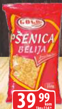
PŠENICA BELIJA 350G GOLD