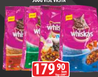
HRANA ZA MAČKE WHISKAS 300G VIŠE VRSTA