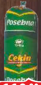
PILEĆA POSEBNA KOBASICA CEKIN 350G