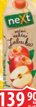
SOK NEXT CLASSIC 1,5L JABUKA