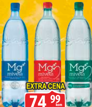
VODA MG MIVELA 1,75L NEGAZIRANA BLAGO GAZIRANA/GAZIRANA