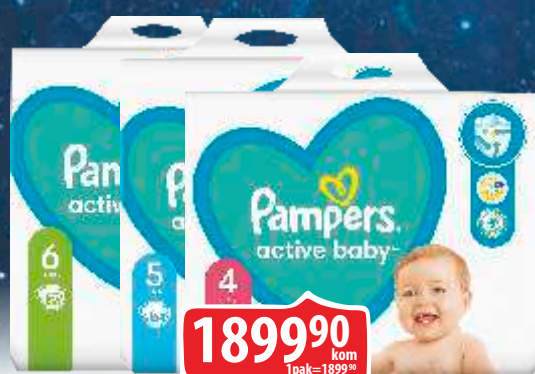
PELENE PAMPERS VIŠE VRSTA