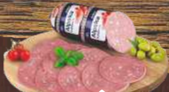
ALPSKA KOBASICA DOBRO RFS