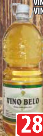
VINO BELO 2L PET VINARIJA STATUS