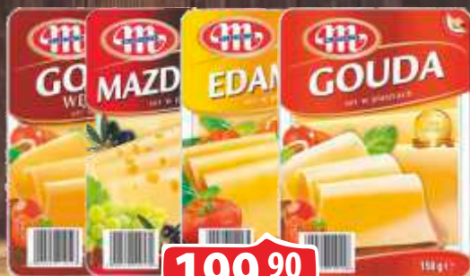
SIR KAČKAVALJ MLEKOVITA 150G EDAMSKI GAUDA DIMLJENI /MADAMER GAUDA SEČENA