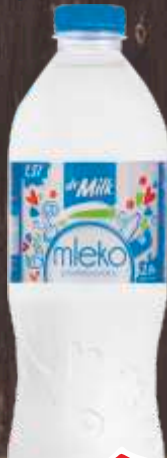
MLEKO DR MILK 2,8% MM 1.5L PET