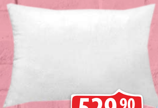
JASTUK 50X70CM NATA PILLOW CLASSIC