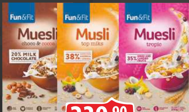
MUSLI FLORIDA 250G CHOCO-KAKAO TOP/TROPIC