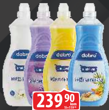
OMEKŠIVAČ DOBRO 2L VIŠE VRSTA