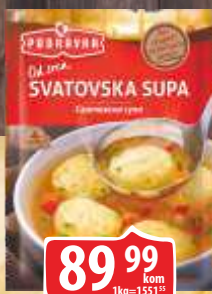
SUPA PODRAVKA 58G SVATOVSKA