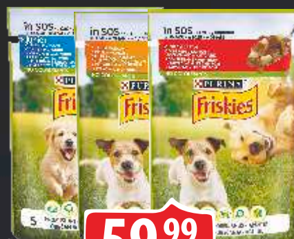
HRANA ZA PSE FRISKIES 85G VIŠE VRSTA