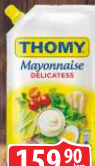
MAJONEZ THOMY 280ML DOJPAK