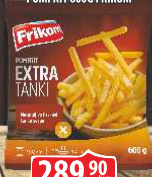
SMRZNUTI EKSTRA TANKI POMFRIT 600G FRIKOM