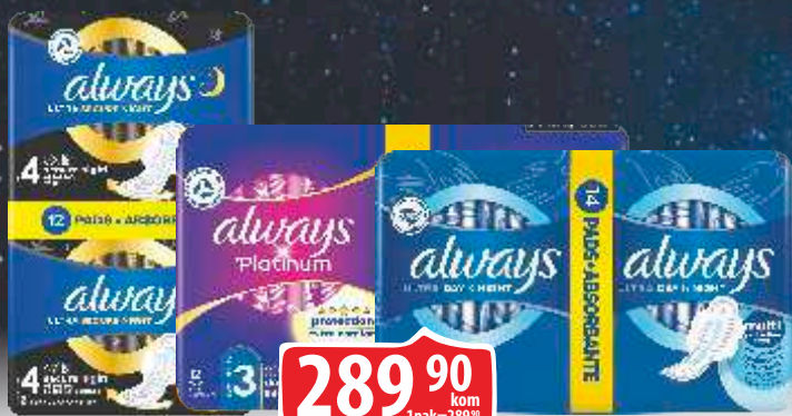
ULOŠCI ALWAYS VIŠE VRSTA