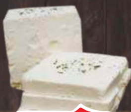
SIR HOMOLJSKA BELA KRIŠKA RFS