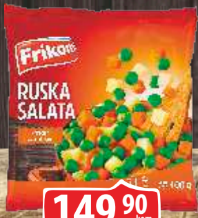
SMRZNUTO POVRĆE ZA RUSKU SALATU FRIKOM 400G