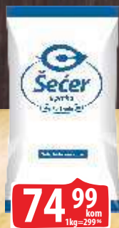
ŠEĆER PRAH C 250G