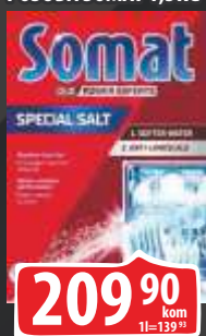
SO ZA MAŠINSKO PRANJE POSUĐA SOMAT 1,5KG