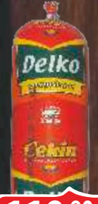
KOBASICA DELKO SA PAPRIKOM CEKIN 350G