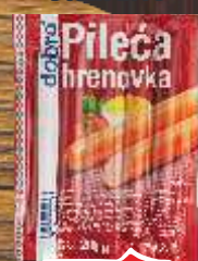
PILEĆA HRENOVKA DOBRO 200G