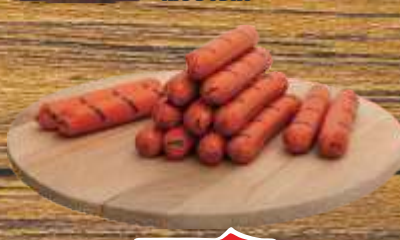
HRENOVKE PILEĆE RFS DOBRO