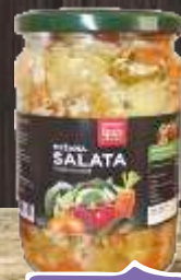
SALATA MEŠANA 720G FORTUNA ŠPAJZ