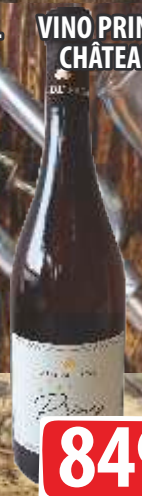
VINO PRINCESS 0,75L CHÂTEAU PRINCE