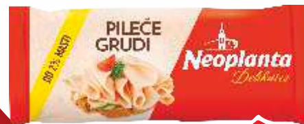
PILEĆE GRUDI MINI DELIKATES NEOPLANTA 350G