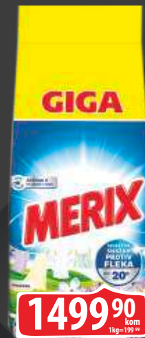
DETERDŽENT MERIX JORGOVAN 7.5KG