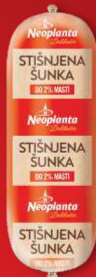
STIŠNJENA ŠUNKA DELIKATES NEOPLANTA RFS