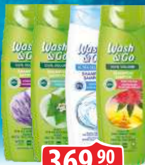
ŠAMPON WASH&GO 360ML VIŠE VRSTA