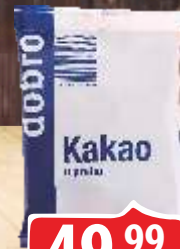
KAKAO DOBRO 100G