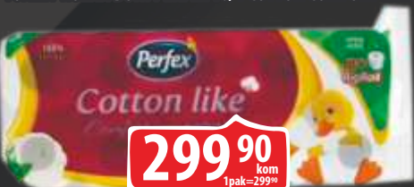
TOALET ROLNA BONI PERFEX 10/1 COTTON COMFORT LINE