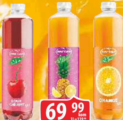
SOK NECTAR NIJE SVEJEDNO 0,5L SOUR CHERRY/MULTIVITAMIN/ORANGE