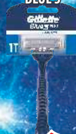
BRIJAČ GILLETTE BLUE 3