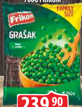
SMRZNUTI GRAŠAK 700G FRIKOM