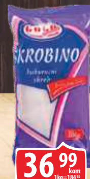
KUKURUZNI SKROB SKROBINO GOLD 200G