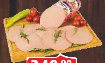
PILEĆA PARISKA KOBASICA DOBRO RFS