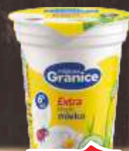
KISELO MLEKO GRANICE 0,18L 6%MM