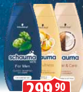
ŠAMPON SCHAUMA 400ML VIŠE VRSTA