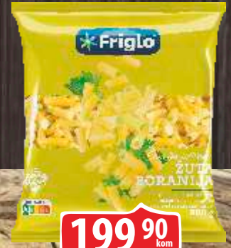
SMRZNUTA BORANIJA ŽUTA 900G FRIGLO