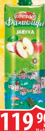
SOK NECTAR FAMILY 1L JABUKA