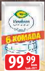
VINOBRAN C 10G 6/1