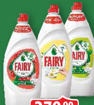
TEČNOST ZA POSUĐE FAIRY 800ML NAR/SENSITIVE/JABUKA