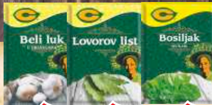
BELI LUK C U GRANULAMA 23G 30/1