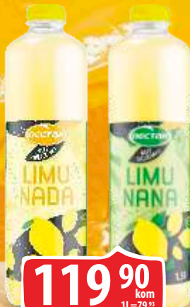
SOK NECTAR NIJE SVEJEDNO 1,5L LIMUNADA PET