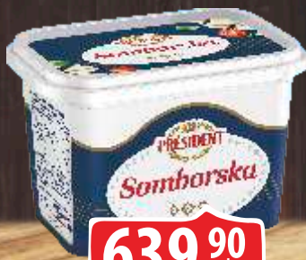
SIR PRESIDENT SOMBORSKA 900G