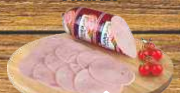
ŠUNKA U CREVU DOBRO RFS