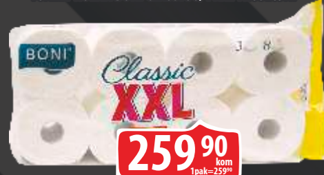
TOALET ROLNA BONI CLASSIC 8/1 XXL TROSLOJNI