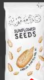
SEMENKE SUNCOKRETA FLORIDA BEL 100G OLUŠTENE