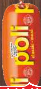
PARIZER POLI MAXI PTUJ RFS