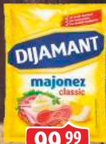
MAJONEZ DIJAMANT DELIKATESNI 190ML