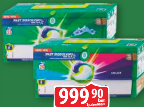
DETERDŽENT ARIEL CAPSULES PODS 29/1 MOUNTAIN SPRING/COLOR