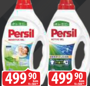
DETERDŽENT TEČNI PERSIL 855ML SENSITIVE GEL/GEL COLOR 990ML DEEP CLEAN