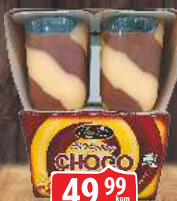
PUDING CHOCO-LOCO 125G ČOKOLADA-VANILA