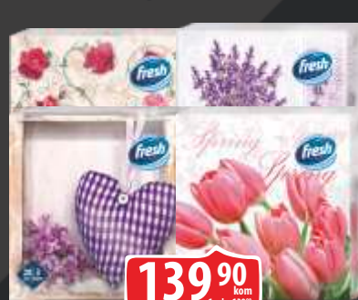
SALVETE FRESH 33X33 20/1 VIŠE VRSTA