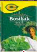
BOSILJAK C 9G