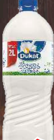
MLEKO SVEŽE DUKAT 2,8%MM 2L SOMBOLED