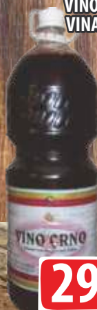
VINO CRNO 2L PET VINARIJA STATUS