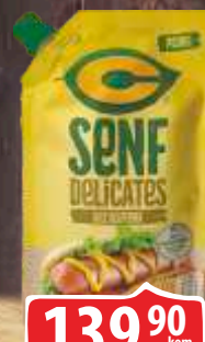
C-SENF C DOJPAK 280G