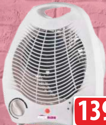
GREJALICA NEXSAS NFHS-2000 1000/2000W