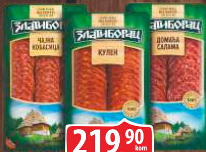
ČAJNA KOBASICA/DOMAĆA SALAMA KULEN ZLATIBORAC 100G SLAJS