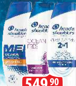
ŠAMPON HEAD&SHOULDERS 400ML VIŠE VRSTA