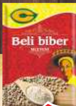
BIBER BELI C 20G MLEVENI 35/1