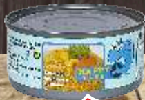
TUNJEVINA HAPPY TUNA 180G KOMADIĆI U SALAMURI