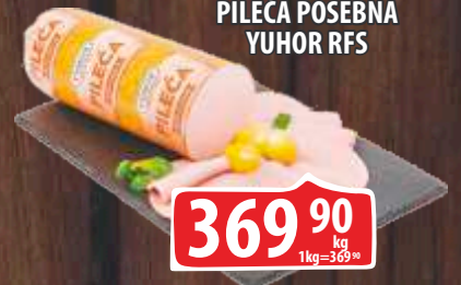
PILEĆA POSEBNA YUHOR RFS