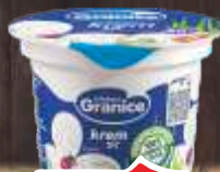
KREM SIR GRANICE 100G