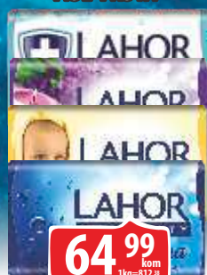
SAPUN LAHOR 80G VIŠE VRSTA