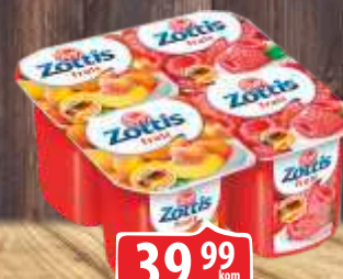
DESERT MLEČNI ZOTTIS 115G FRUIT