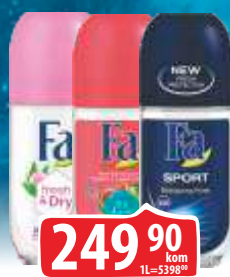
DEZODORANS ROLLON FA 50ML VIŠE VRSTA