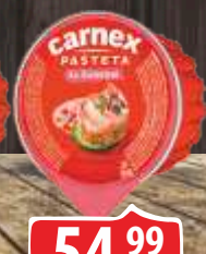
PAŠTETA JETRENA CARNEX 50G