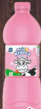
JOGURT IMLEK KRAVICA 1.5L 2,8% PET