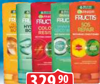
REGENERATOR GARNIER FRUCTIS 200ML VIŠE VRSTA