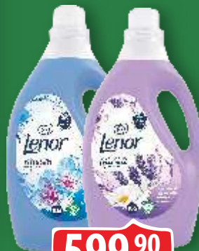
OMEKŠIVAČ LENOR 2.65L SPRING AWAKENING LAVANDER&CAMOMILE