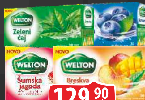
ČAJ WELTON VIŠE VRSTA