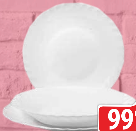
TANJIR FESTON/PRIMA DESERTNI 19,5CM DUBOKI/ PLITKI 25,5CM