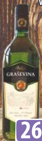
VINO GRAŠEVINA RUBIN 1L