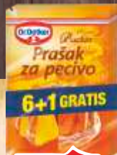
PRAŠAK ZA PECIVO DR.OETKER 6+1 GRATIS