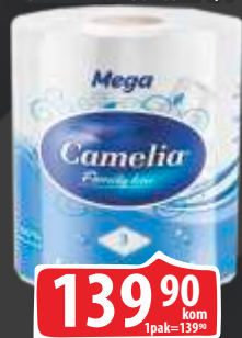
PAPIRNI UBRUS MEGA CAMELIA TROSLOJNI 1/1