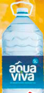
VODA AQUA VIVA 5L OBICAN CEP