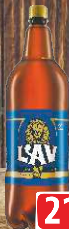
PIVO LAV 2L