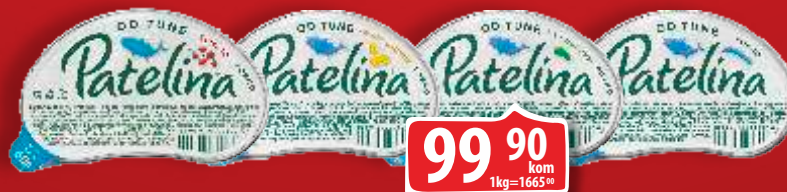
PAŠTETA PATELINA OD TUNE SA POVRĆEM POSNO TUNA/TUNA SA KUKURUZOM/ TUNA TOMATO 60G NEOPLANTA