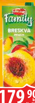
SOK NECTAR FAMILY 1,5 BRESKVA