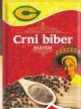
BIBER CRNI C 20G MLEVENI 35/1