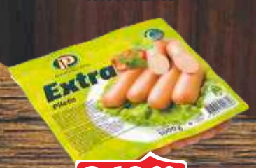
VIRŠLE PILEĆA EXTRA 1000G POLI PTUJ