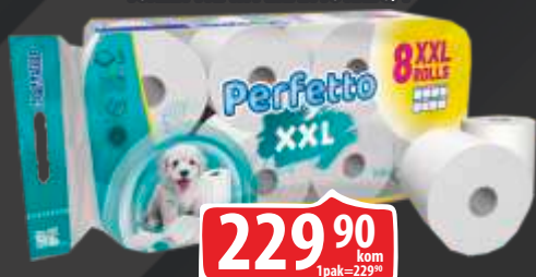
TOALET PAPIR PERFETTO XXL 8/1