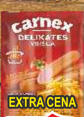
VIRŠLA CARNEK DELIKATES 205G