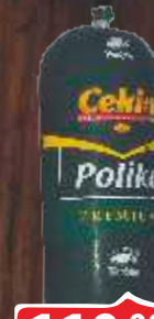
KOBASICA POLIKO PREMIUM CEKIN 350G