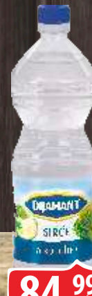
SIRĆE ALKOHOLNO DIJAMANT 1L