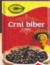
BIBER U ZRNU C 20G 30/1