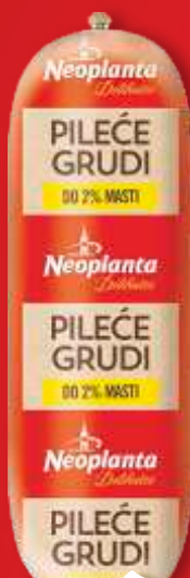
PILEĆE GRUDI DELIKATES NEOPLANTA RFS