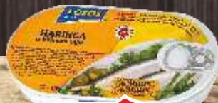
HARINGA U ULJU 170G LOSOS