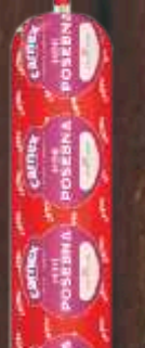
POSEBNA KOBASICA MINI 300G CARNEK