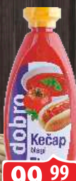
KEČAP DOBRO 500ML BLAGI BOCA