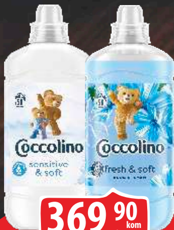
OMEKŠIVAČ COCCOLINO 1450ML BLUE/SENSITIVE