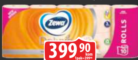
TOALET ROLNA ZEWA DELUXE 10/1 BRESKVA