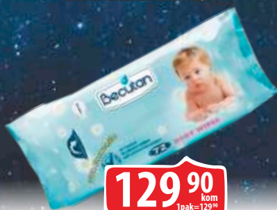
MARAMICE VLAŽNE BECUTAN BABY 72/1