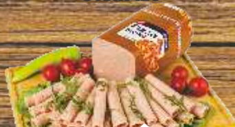
PIZZA ŠUNKA DOBRO RFS