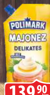
MAJONEZ POLIMARK 280ML