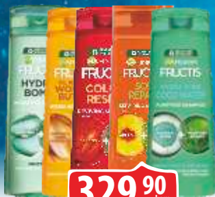
ŠAMPON GARNIER FRUCTIS 250ML VIŠE VRSTA