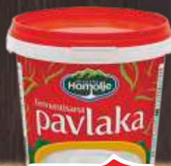
KISELA PAVLAKA EKOFIL 700G 20%MM