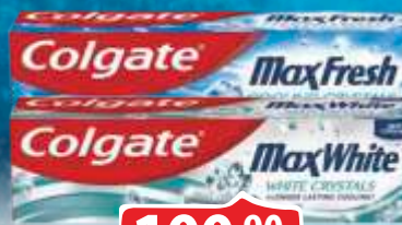
PASTA ZA ZUBE COLGATE 75ML VIŠE VRSTA