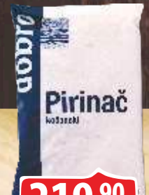
PIRINAČ DOBRO 1KG