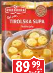
SUPA PODRAVKA 67G TIROLSKA