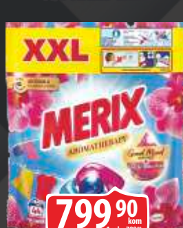
DETERDŽENT MERIX KAPSULE 44/1 ORCHID COLOR