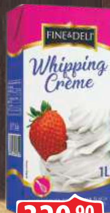
SLATKA PAVLAKA 1L FINE&DELI 25%MM ZA ŠLAG