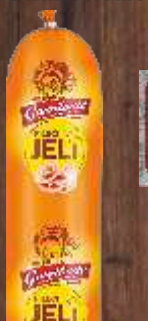
PILEĆA KOBASICA JELI GAVRILOVIĆ RFS