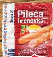
HRENOVKA PILEĆA 800G DOBRO