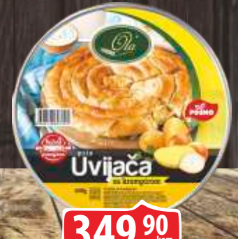
SMRZNUTI BUREK SA KROMPIROM 600G UVIJAČA MOD COMMERCE