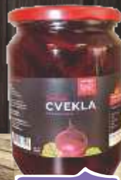
CVEKLA 690G FORTUNA ŠPAJZ