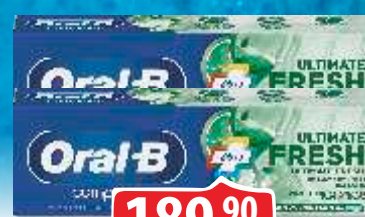
PASTA ZA ZUBE ORAL B MINT/FRESH 75ML