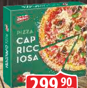
SMRZNUTA PIZZA CAPRICCIOSA 330G FRIKOM