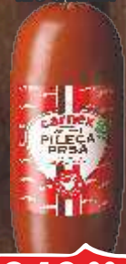
PILEĆA PRSA DIMLJENA U OMOTU RFS CARNEK