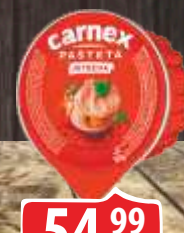
PAŠTETA SA ŠUNKOM CARNEX 50G