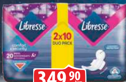
ULOŠCI LIBRESSE GOODNIGHT MAXI DUO 20/1