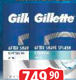
LOSION POSLE BRIJANJA GILLETTE 100ML REVITALIZING SPLASH ARCTIC ICE SPLASH