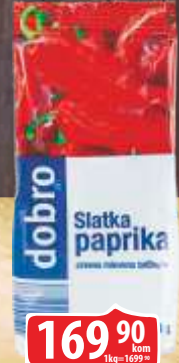
PAPRIKA DOBRO 100G SLATKA