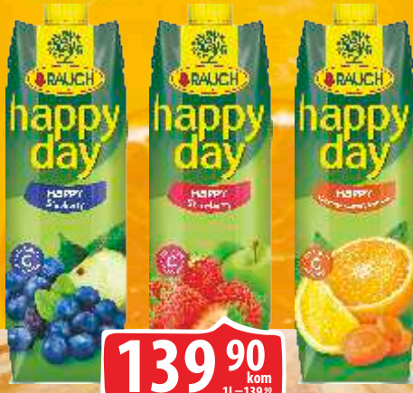
SOK RAUCH HAPPY DAY FAMILY 1L BOROVNICA/JAGODA/ORANGE, CARROT, LEMON