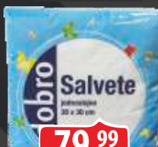
SALVETE DOBRO 30X30 100/1 BELE JEDNOSLOJNE