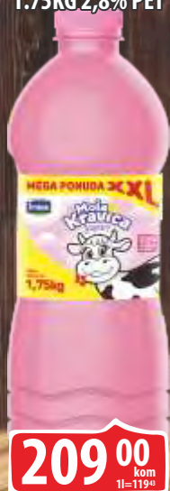
JOGURT IMLEK KRAVICA 1.75KG 2,8% PET