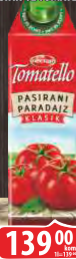
PARADAJZ PASIRANI NECTAR 1L TOMATELLO