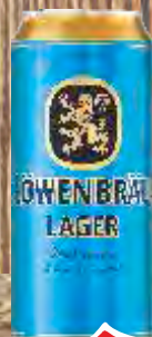
PIVO LOWENBRAU 0,5L LIMENKA