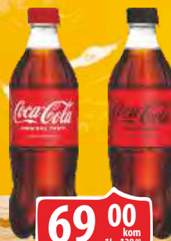
SOK COCA COLA 0,5L SOK COCA COLA 0,5L ZERO