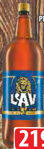
PIVO LAV 2L