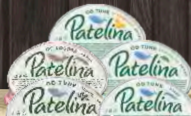
PAŠTETA PATELINA OD TUNE VIŠE VRSTA 60G