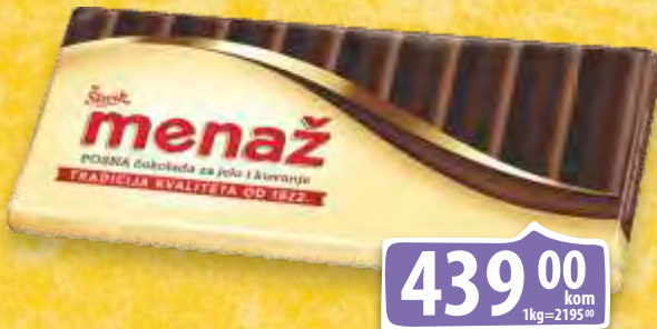
ČOKOLADA MENAŽ 200G