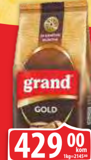
KAFA GRAND GOLD 200G