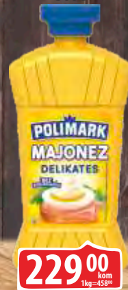
MAJONEZ POLIMARK 500G