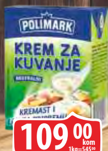
KREM ZA KUVANJE 200ML POLIMARK