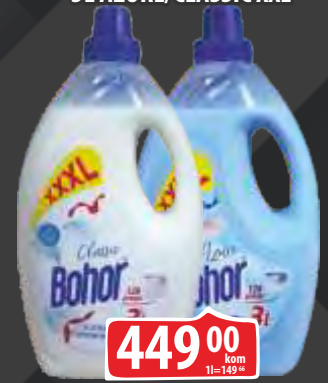
OMEKŠIVAČ BOHOR 3L AZURE/CLASSIC XXL