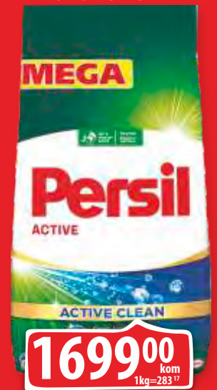
DETERDŽENT PERSIL 6KG POWDER