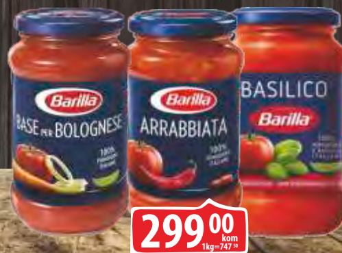
SOS BARILA 400G BOLOGNESE ARRABBIATA/BASILICO