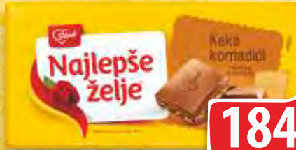
ČOKOLADA NAJLEPŠE ŽELJE 85G SA KEKSOM