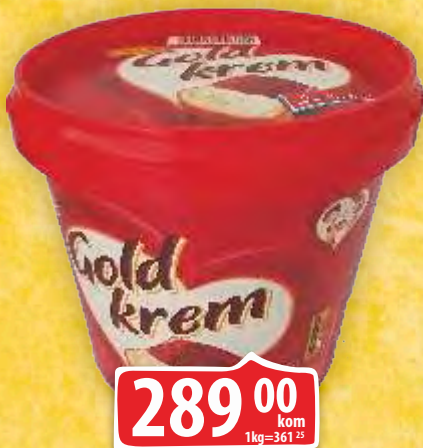
KREM GOLD PACK 800G