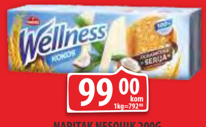
KEKS WELLNESS INTEGRALNI SA KOKOSOM 125G