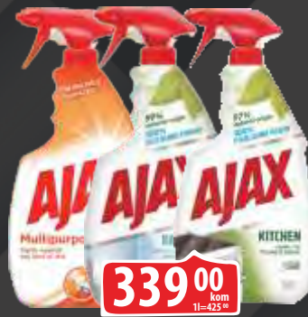
SREDSTVO ZA ČIŠĆENJE AJAX 750ML VIŠE VRSTA