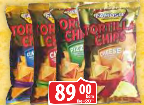
TORTILJA ČIPS FAMOSO 150G VIŠE VRSTA