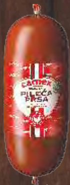
PILEĆA PRSA DIMLJENA U OMOTU RFS CARNEX