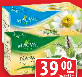
ČAJ MACVAL SIMPLY KAMILICA/NANA