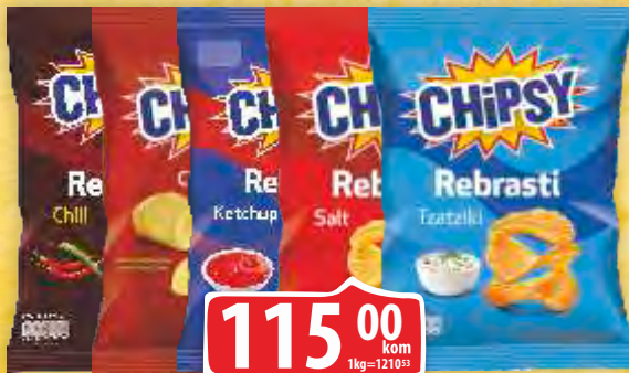
CHIPSY MARBO 90G VIŠE VRSTA