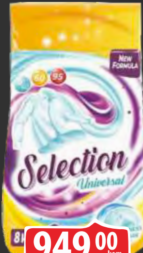
DETERDŽENT SELECTION UNIVERSAL 8KG