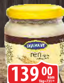
REN DIJAMANT 190G