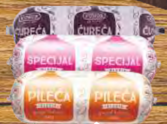
ČUREĆA KOBASICA KLASIK YUHOR PILEĆA KLASIK/ SPECIJAL KLASIK 325G