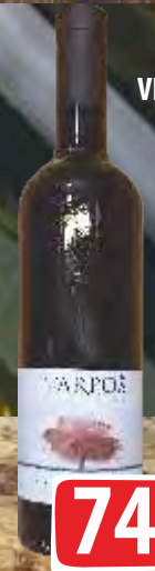
VINO CUVEE 0,75L CRVENI VINARIJA TARPOŠ