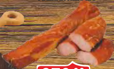
PEČENICA TRLIĆ RFS