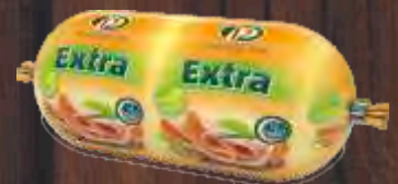
POSEBNA EXTRA PILEĆA 600G PTUJ