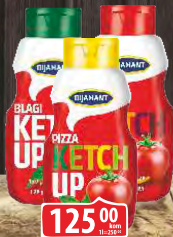
KEČAP DIJAMANT 500G BLAGI PIZZA/LJUTI