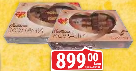
KOLAČI SLATKO SRCE 1KG