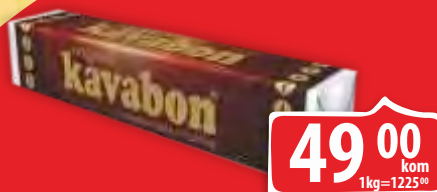
BOMBONE KAVABON 40G