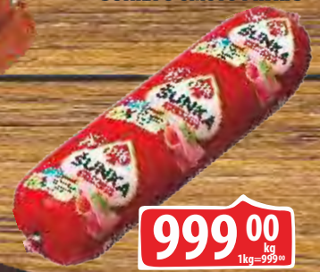
ŠUNKA U OMOTU PIK RFS