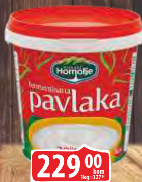
KISELA PAVLAKA EKOFIL 700G 20%MM