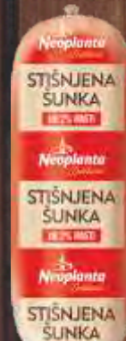
STIŠNJENA ŠUNKA DELIKATES NEOPLANTA RFS