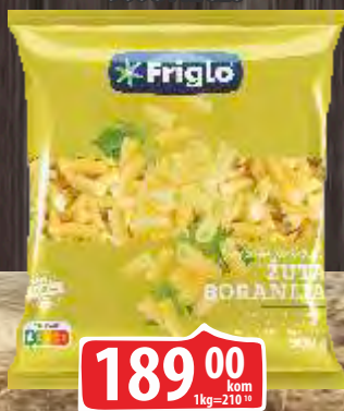
SMRZNUTA BORANIJA 900G FRIGLO