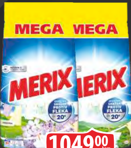
DETERDŽENT MERIX 6KG JORGOVAN COMPACT GORSKA SVEŽINA COMPACT