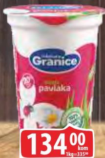
KISELA PAVLAKA GRANICE 20% MM 0,4L