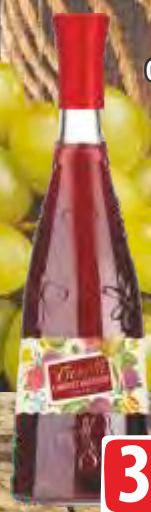
VINO FIORELI 0,75L CABERNET SAUVIGNON