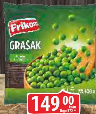
SMRZNUTI GRAŠAK FRIKOM 400G