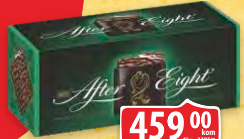
ČOKOLADA AFTER EIGHT 200G MINT CREAM