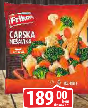
SMRZNUTA CARSKA MEŠAVINA 400G FRIKOM