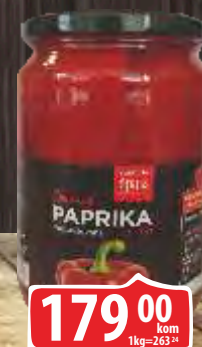
PAPRIKA FILETI 680G FORTUNA ŠPAJZ