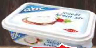
KREM SIR ABC 100G