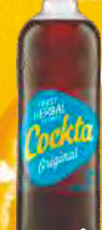
SOK COCKTA 1,5L ORIGINAL FINEST HERBAL