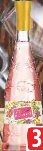
VINO MUSCAT FIORELI 0,75L ROSE