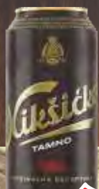
PIVO NIKŠIČKO TAMNO LIMENKA 0,5L