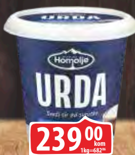
SIR ALBUMINSKI URDA EKOFIL 350G