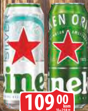
PIVO HEINEKEN 0,5L LIMENKA PIVO HEINEKEN 0,5L SILVER