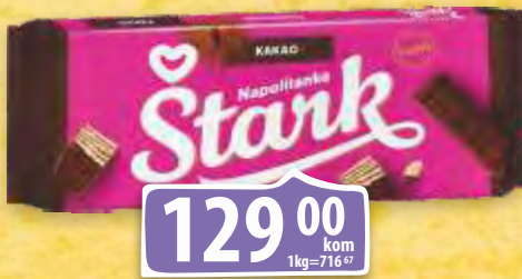
NAPOLITANKA ŠTARK SA KAKAO PRELIVOM 180G