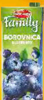
SOK NECTAR FAMILY 1,5L BOROVNICA