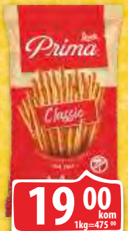
GRISINE PRIMA 40G