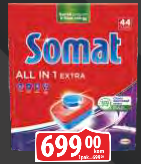
TABLETE ZA MAŠINSKO PRANJE POSUDA SOMAT 44/1 EXTRA