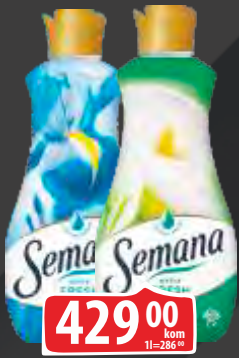
OMEKŠIVAČ SEMANA 1,5L VIŠE VRSTA