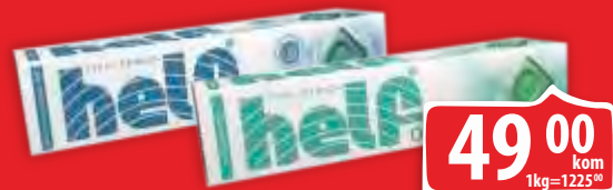
BOMBONE HELF MENTOL EUKALIPTUS/ORRGINAL 40G