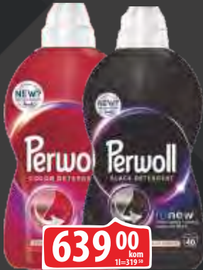
DETERDŽENT TEČNI PERWOLL 2L CRVENI/ BLACK