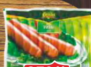
VIRŠLA PILEĆA CLASSIC 1KG CEKIN