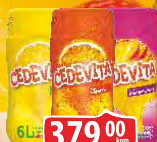
CEDEVITA VIN 455G LIMUN/ NARANDZA/ANANAS&MANGO