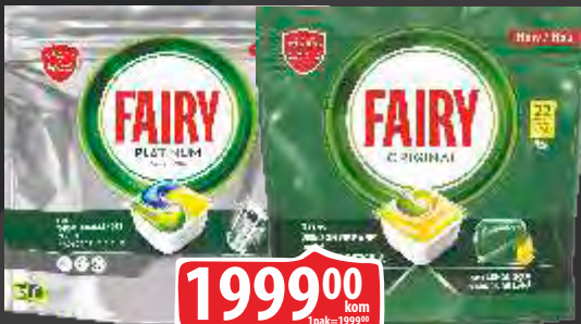
TABLETE FAIRY ZA SUDOVE 96/1 PLATINUM /116/1 LIMUN