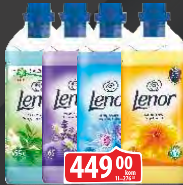
OMEKŠIVAČ LENOR 1.625ML VIŠE VRSTA