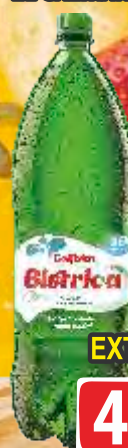
VODA BISTRICA 2L GAZIRANA