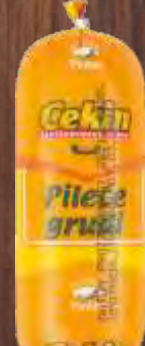
PILEĆE GRUDI CEKIN MAXI RFS