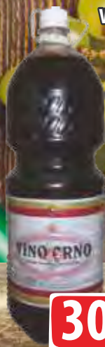
VINO CRNO 2L VINARIJA STATUS PET