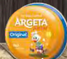
PAŠTETA ARGETA JUNIOR 95G