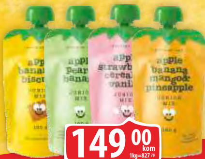
NUTRINO LAB JUNIOR MIX PAUČ 180G VIŠE VRSTA