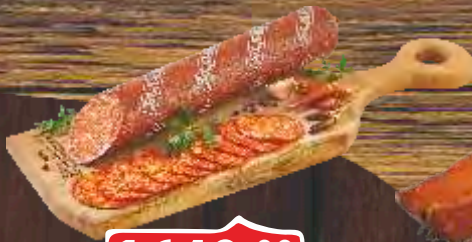
KULEN ZLATIBORAC RFS