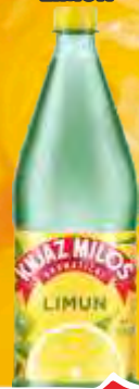
VODA KNJAZ MILOS 1,25L LIMUN