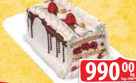
TORTA SLATKO SRCE NUGAT MALINA VIŠE OBLIKA