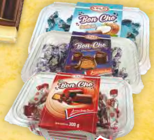
BOMBONE BON CHO CAPPUCCINO GOLD/KAREMELA/KOKOS 300G