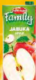
SOK NECTAR FAMILY 1,5L JABUKA