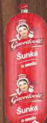
ŠUNKA U OMOTU 350G GAVRILVIĆ