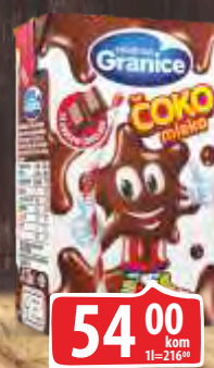
MLEKO ČOKOLADNO 0,25L GRANICE