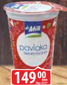
PAVLAKA FERMENTISANA DR MILK 20% MM 400G ČAŠA