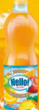
SOK HELLO 1,5L MULTIVITAMIN