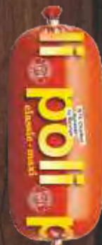
PARIZER POLI MAXI PTUJ RFS