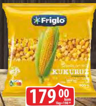
SMRZNUTI ŠEĆERAC 900G FRIGLO