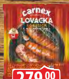
LOVAČKA KOBASICA CARNEX 520G