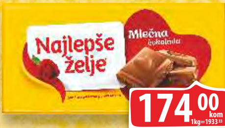
ČOKOLADA NAJLEPŠE ŽELJE 90G