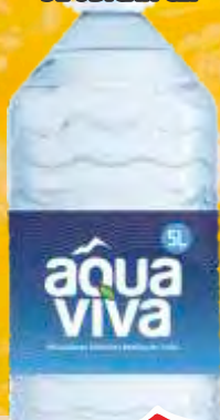
VODA AQUA VIVA 5L OBICAN CEP