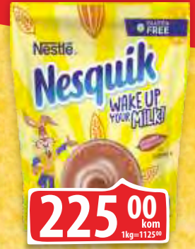
NAPITAK NESQUIK 200G