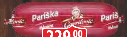
PARISKA KOBASICA 350G GAVRILVIĆ