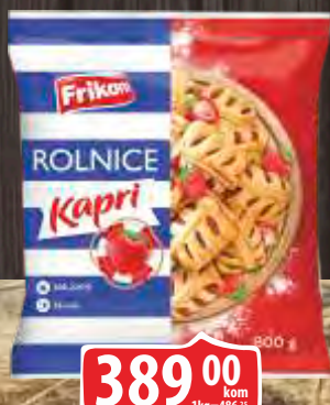
SMRZNUTE ROLNICE FRIKOM 800G KAPRI