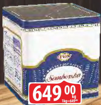
SIR PRESIDENT SOMBORSKA RFS