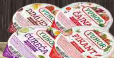
PAŠTETA YUHOR VIŠE VRSTA 50G