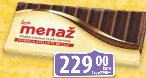
ČOKOLADA MENAŽ 100G