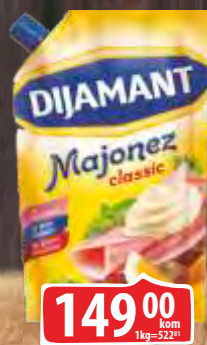
MAJONEZ DIJAMANT DELIKATESNI 285G DOJPAK