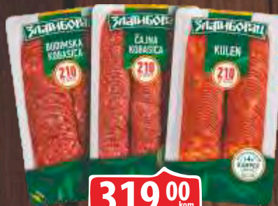
BUDIMSKA/ČAJNA /KULEN KOBASICA 210G KAMPER ZLATIBORAC