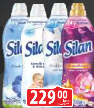
OMEKŠIVAČ SILAN 770ML VIŠE VRSTA