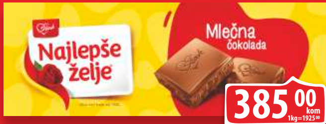
ČOKOLADA NAJLEPŠE ŽELJE 200G