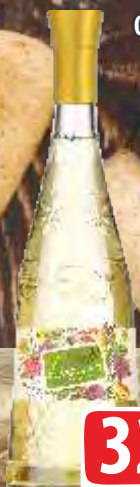
VINO FIORELI 0,75L CHARDONNAY