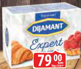
MARGARIN DIJAMANT 250G EXPERT