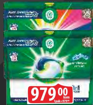
DETERDŽENT ARIEL CAPSULES PODS 29/1 MOUNTAIN SPRING/COLOR