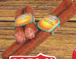
ČAJNA KOBASICA TRLIĆ RFS