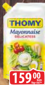
MAJONEZ THOMY 280ML DELIKATESNI DOJPAK