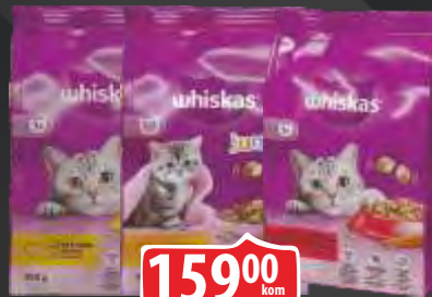
HRANA ZA MAČKE WHISKAS 300G VIŠE VRSTA