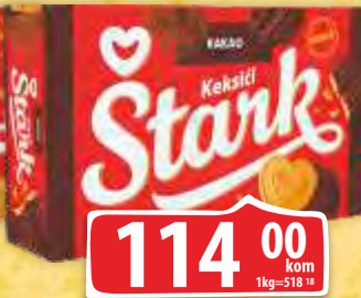
KEKS ČOKO KEKSIČ 220G ŠTARK