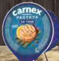
PAŠTETA CARNEX OD TUNE 75G