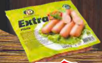
VIRŠLE PILEĆA EXTRA 1000G POLI PTUJ