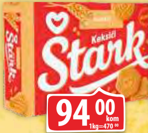
KEKSIČ NEPRELIVENI 200G ŠTARK