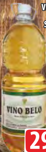
VINO BELO 2L VINARIJA STATUS PET