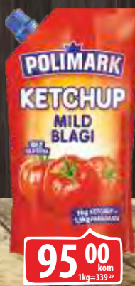
KEČAP POLIMARK 280ML BLAGI DOJPAK