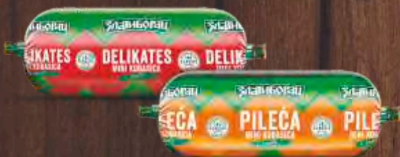
POSEBNA KOBASICA DELIKATES PILEĆA POSEBNA/ MINI ZLATIBORAC 320G