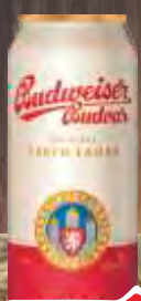
PIVO BUDWEISER 0,5L LIMENKA