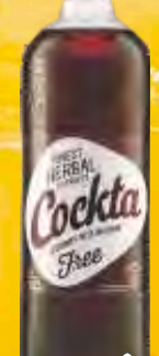
SOK COCKTA 1,5L FINEST HERBAL FREE