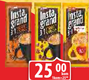
KAFA GRAND INSTANT 3IN1 18G CHOCO BANANA CHOCO ORANGE/NAJLEPŠE ŽELJE