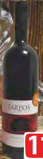
VINO CRVENO MERLOT 0,75L VINARIJA TARPOŠ