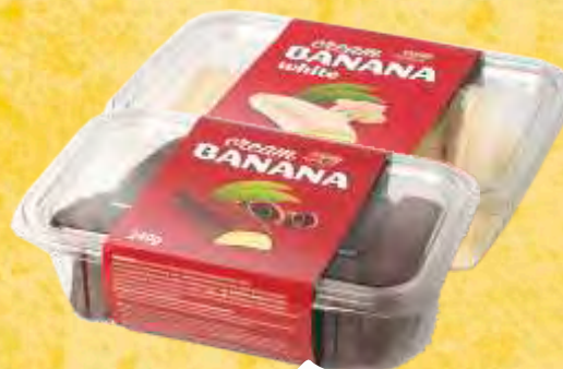
KREM BANANA 240G CANDY RUSH BELA/CRNA