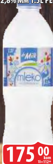
MLEKO DR MILK 2,8% MM 1.5L PET