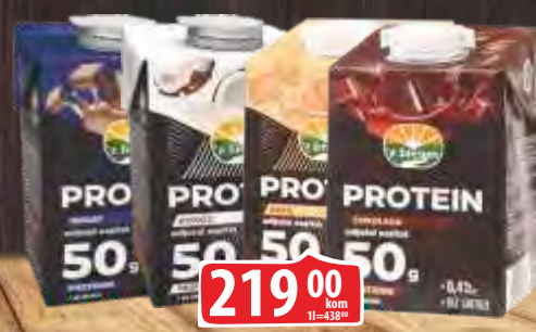
NAPITAK MLEČNI PROTEIN 0,5L TB Z BREGOV VINDIJA VIŠE VRSTA