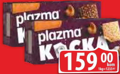
PLAZMA KOCKA PRELIVENA ČOKOLADOM PRELIVENA BELOM ČOKOLADOM 130G