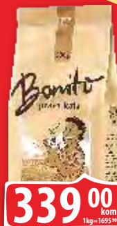
KAFA BONITO 200G