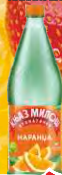
VODA KNJAZ MILOS 1,25L NARANDZA