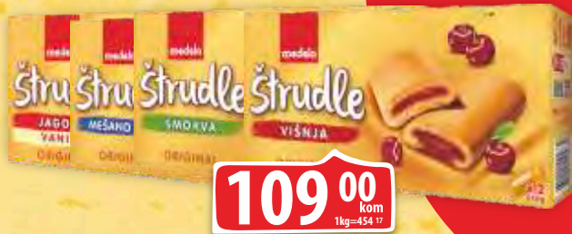
ŠTRUDLA MEDELA 240G VIŠE VRSTA