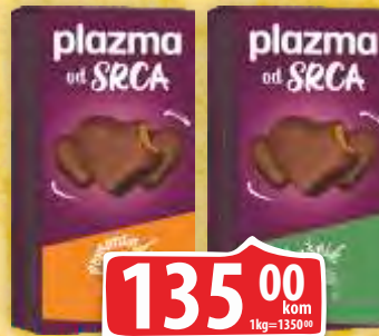
KEKS PLAZMA OD SRCA 100G LEŠNIK/NARANDŽA