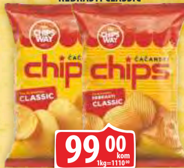
CHIPS WAY 90G CLASSIC REBRASTI CLASSIC