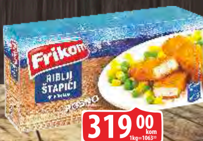
RIBLJI ŠTAPIĆI PANIRANI 300G FRIKOM