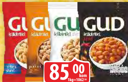
KIKIRIKI MARBO GUD 80G VIŠE VRSTA