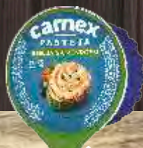
PAŠTETA RIBLJA CARNEX 75G SA POVRĆEM