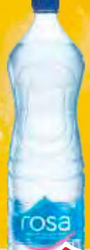
VODA ROSA 1,5L NEGAZIRANA