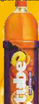
SOK TUBE MULTIVITAMIN 1,5L PET KNJAZ