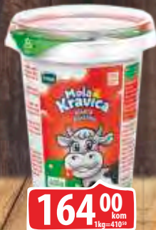
KISELA PAVLAKA 20% IMLEK 0,4L