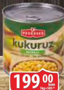
KUKURUZ ŠEĆERAC PODRAVKA 340G