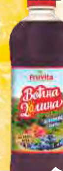
SOK VOČNA DOLINA 1,5L BOROVNICA KOKTEL