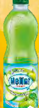
SOK HELLO 1,5L ZELENA JABUKA