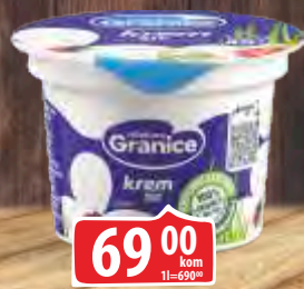
KREM SIR GRANICE 100G