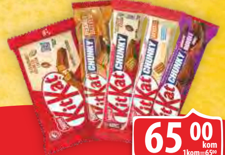
ČOKOLADICA KIT KAT 40G VIŠE VRSTA