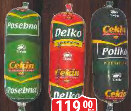
PILEĆA POSEBNA KOBASICA CEKIN KOBASICA DELKO SA PAPRIKOM CEKIN KOBASICA POLIKO PREMIUM CEKIN 350G