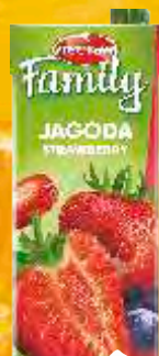
SOK NECTAR FAMILY 1,5L JAGODA