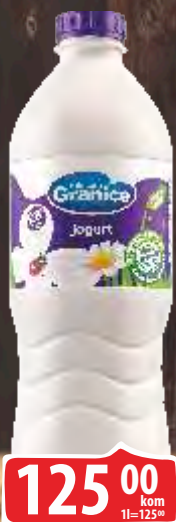
JOGURT GRANICE 1L 2.8% FLAŠA