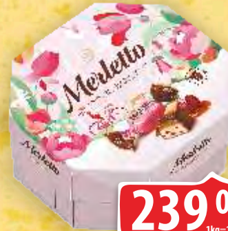
BOMBONJERA MERLETTO 150G NUGAT VIŠNJA I KAREMELA KONTI