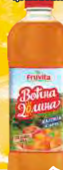
SOK VOČNA DOLINA 1,5LKAJSIJA